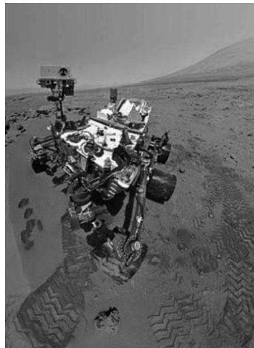
Imatge del Curiosity al cràter Gale, a la superfície de Mart (31 d'octubre de 2012)

DADES: Massa de Mart, M_{\text{Mart}} = 6,42 \times 10^{23}\text{ kg} . Radi de Mart, R_{\text{Mart}} = 3,39 \times 10^6\text{ m} . G = 6,67 \times 10^{-11}\text{ N m}^2\text{ kg}^{-2} .