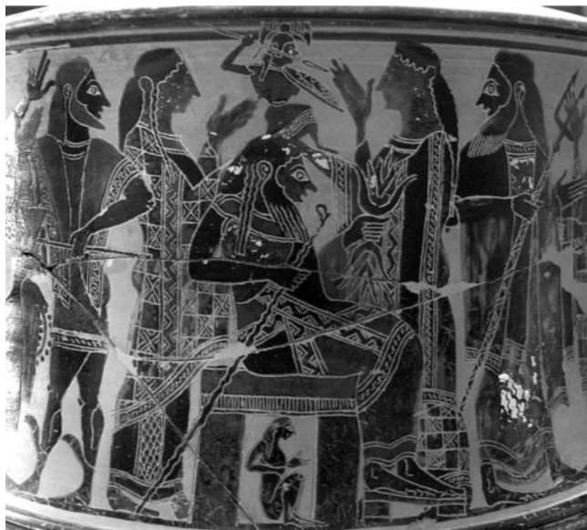
Trípode de figures negres (ca. 570-560 aC), Museu del Louvre (París)