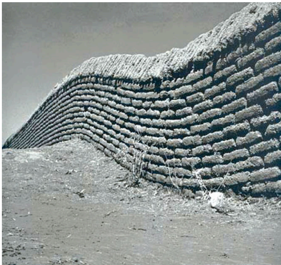
Barda tirada en un campo verde , Juan Rulfo, 1948.

Observeu atentament la fotografia següent, obra de Juan Rulfo, i responeu als apartats 2.1 i 2.2.