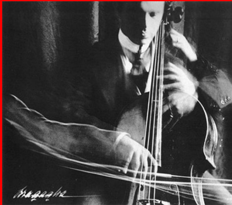
El violoncel·lista , A. G. Bragaglia, 1913.

Observeu atentament aquesta imatge, obra del fotògraf Anton Giulio Bragaglia, i responeu als apartats 2.1 i 2.2.