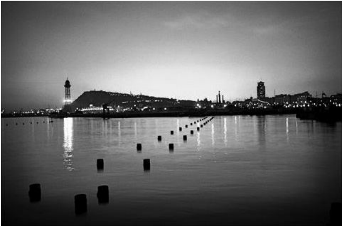
Port, Barcelona, Andreas Kierulf, 1994.

Observeu atentament la fotografia següent, obra del fotògraf català Andreas Kierulf, i responeu als apartats 2.1 i 2.2.