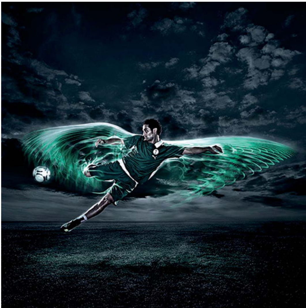
Cameroon football selection, Andy Green, 2010.

Observeu atentament la imatge següent i responeu als apartats 2.1 i 2.2.