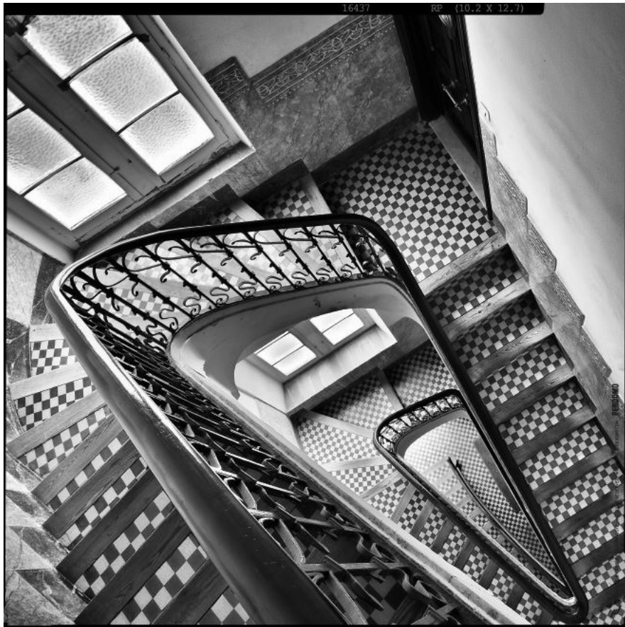
Relativitat , Rubén García Perdomo, 2012

Observeu atentament la imatge següent, del fotògraf tarragoní Rubén García Perdomo, i responeu a les qüestions 2.1 i 2.2.