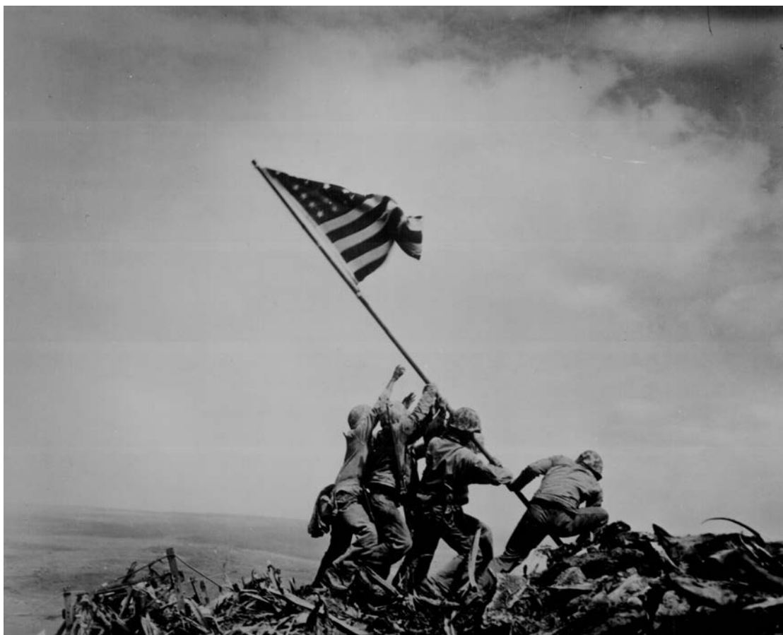
Raising the Flag on Iwo Jima , Joe Rosenthal, 1945.

Observeu atentament la fotografia següent, obra del fotògraf Joe Rosenthal, i responeu a les qüestions 2.1, 2.2 i 2.3.