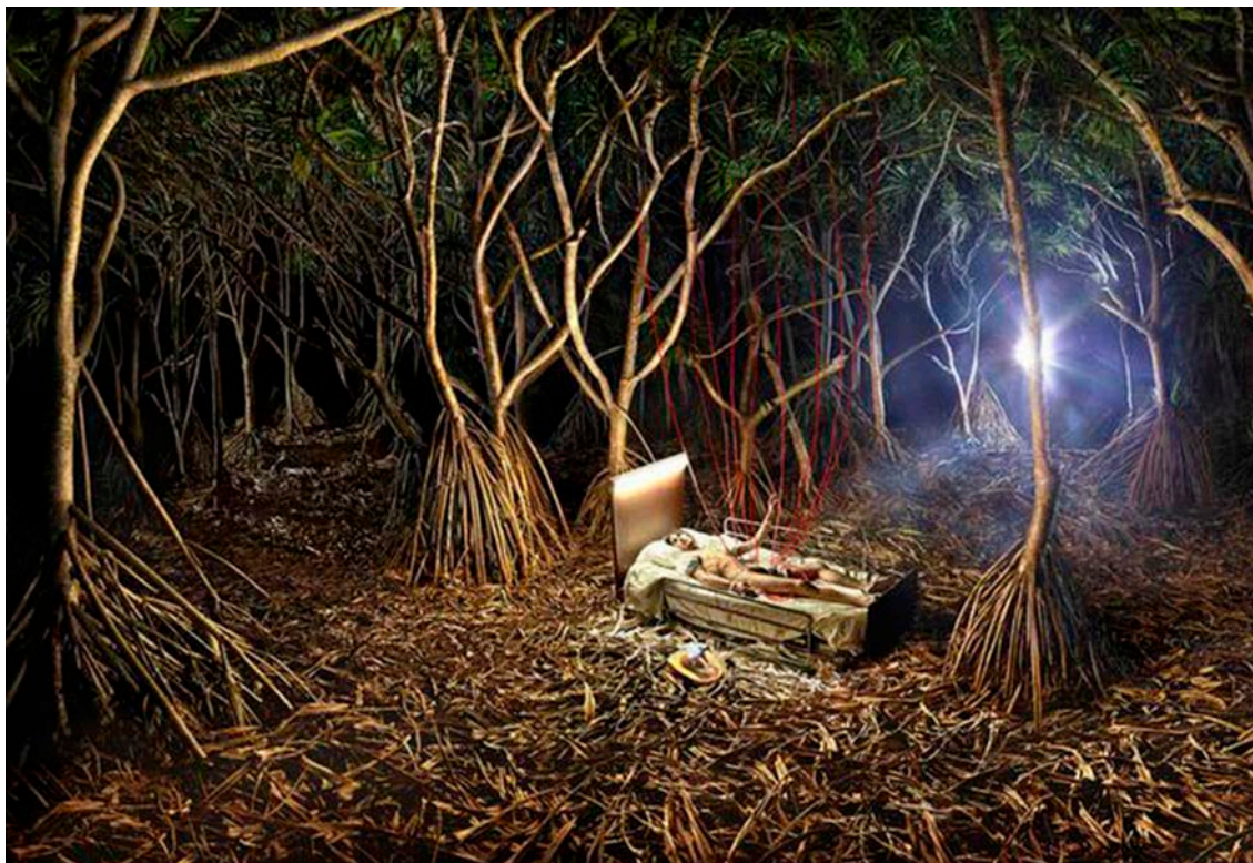
Transfusion , David LaChapelle, 2015.

Observeu atentament la fotografia següent, obra del fotògraf David LaChapelle, i respon-neu a les qüestions 2.1, 2.2 i 2.3.