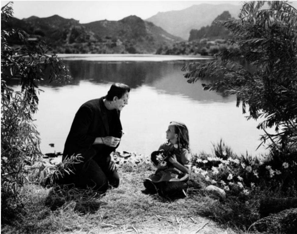
Fotograma de Frankenstein (1931), de James Whale.

Observeu atentament el fotograma següent de la pel·lícula Frankenstein (1931), de James Whale, i responeu a les qüestions 2.1, 2.2 i 2.3.