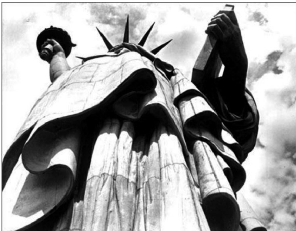
The Statue of Liberty , Margaret Bourke-White, 1930.

Observeu atentament la fotografia següent, obra de la fotògrafa Margaret Bourke-White, i responeu a les qüestions 2.1, 2.2 i 2.3.