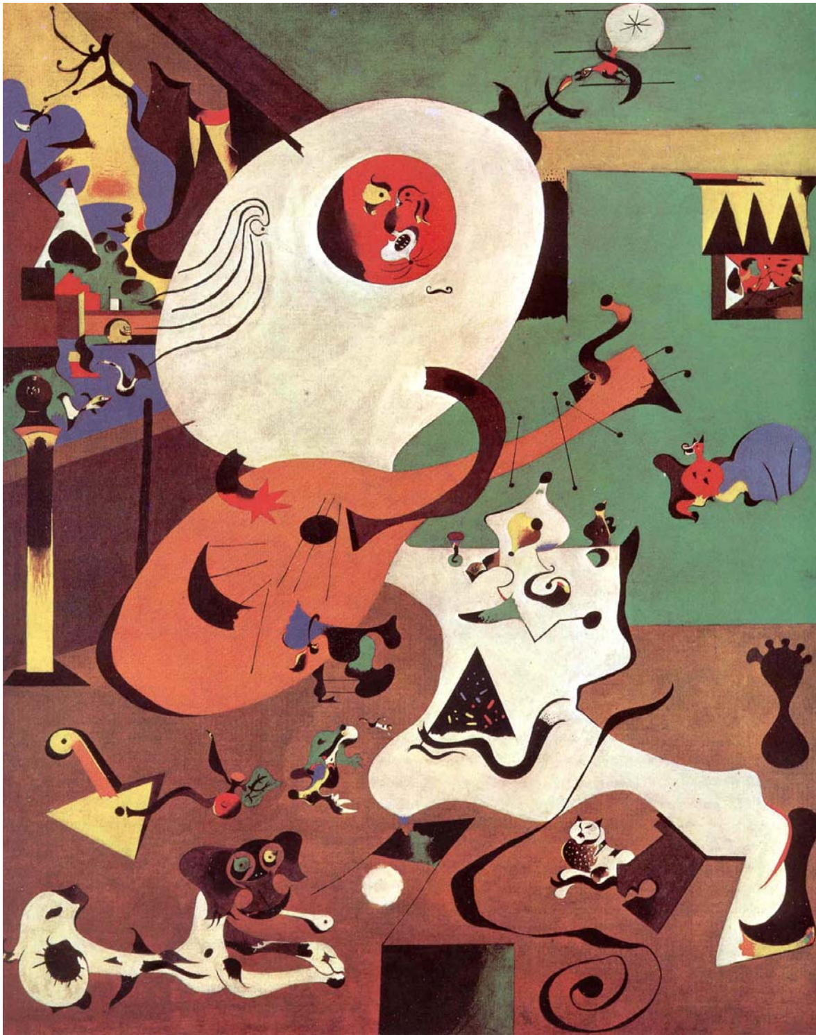
Imatge C. Joan Miró (1856-1993): Interior holandés I , 1928. Oli sobre tela, 92 x 73 cm. The Museum of Modern Art, Nova York.