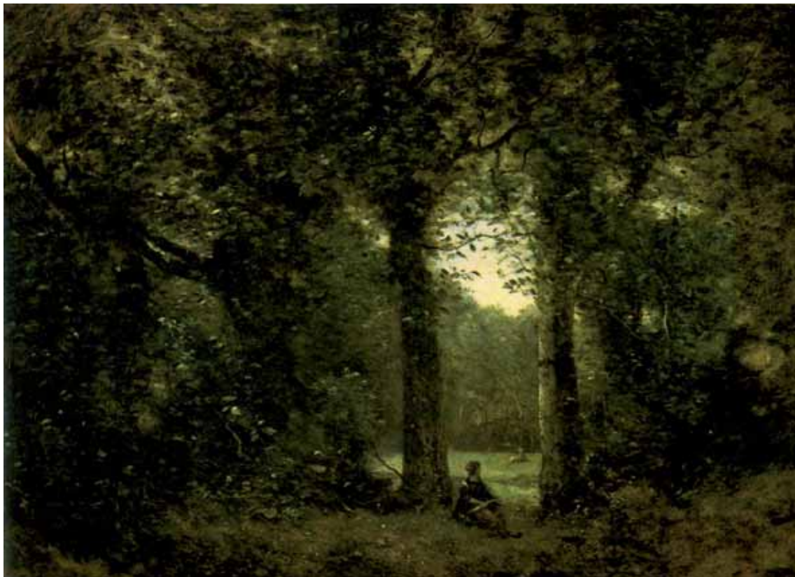
IMATGE A. Jean-Baptiste Camille Corot (1796-1875). La clariana, record de la Ville-d'Avray , 1872. Oli sobre tela, 100 × 134 cm. Museu d'Orsay, París.