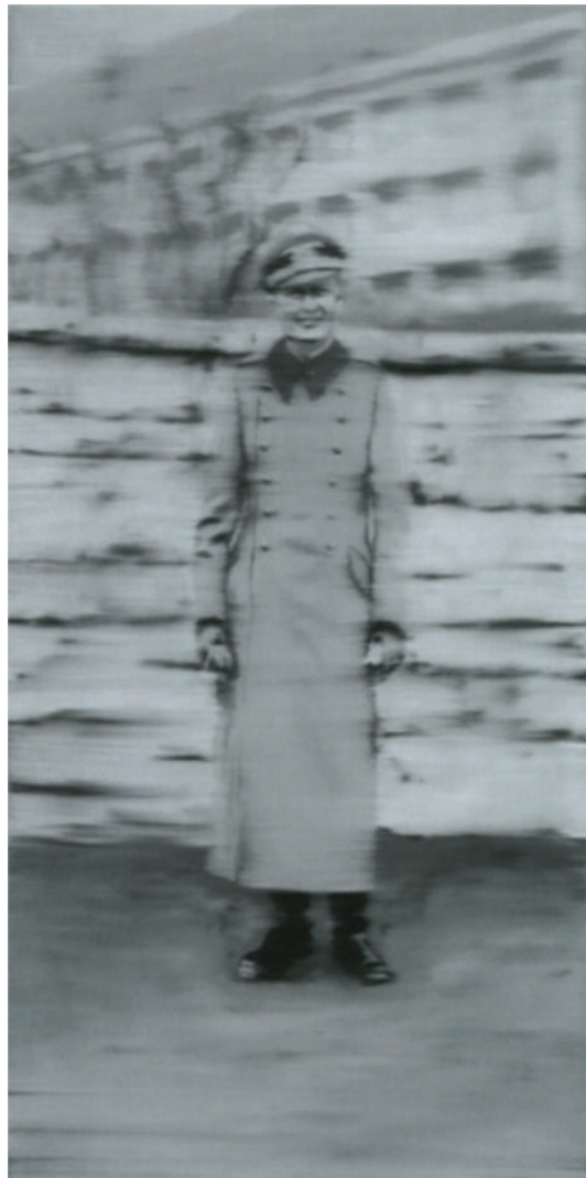
IMATGE B. Gisèle Freund. Maig de 1932 al centre de Frankfurt , 1932. Còpia fotogràfica en blanc i negre, mides variables. Col·lecció particular.