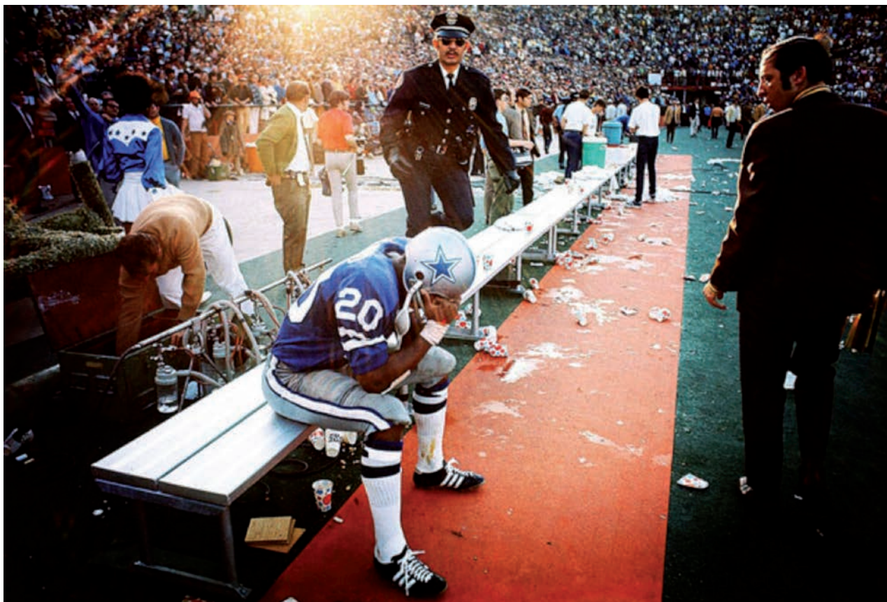
IMATGE 3. Walter Iooss (1943- ). Mel Rento. Superbowl, Miami. Fotografia. A: Walter Iooss [en línia]. < http://walteriooss.com/portfolios/5 > [Consulta: 10 octubre 2016].