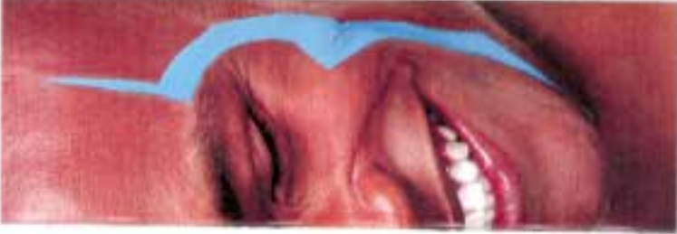
blue jelly skin