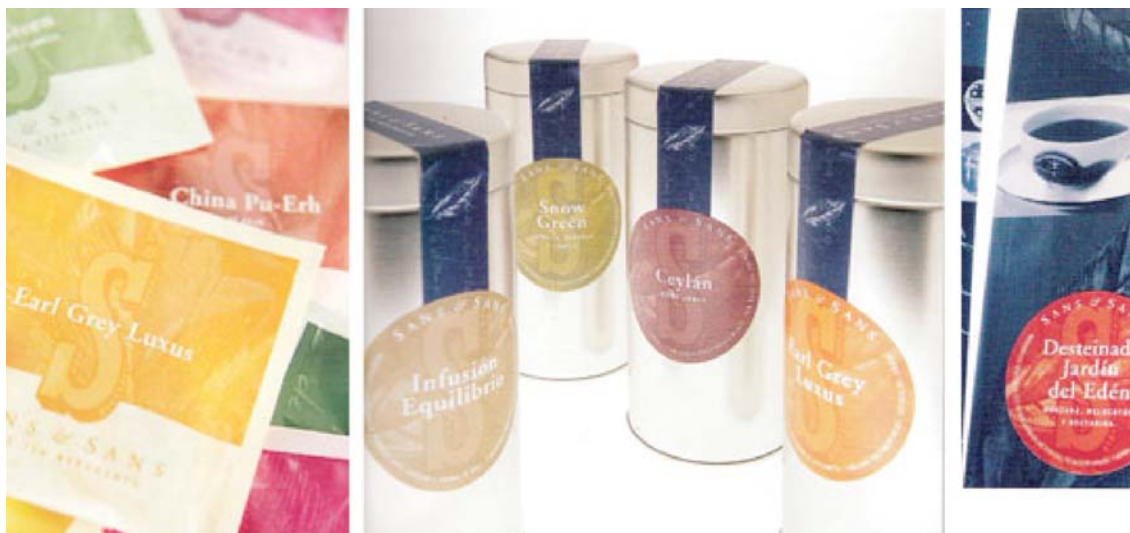
IMATGE C. Aplicacions d'envasament ( packaging ) de les botigues de te Sans & Sans (2003-2006).

2.2. Comenteu les característiques formals i gràfiques d'aquesta línia d'envasament ( packaging ) de productes de te (imatge C).