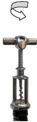
1. Posició de clavament al tap

2.3. En les imatges D i E es poden veure dos llevataps diferents. Feu una valoració comparativa dels aspectes funcionals i formals de tots dos.