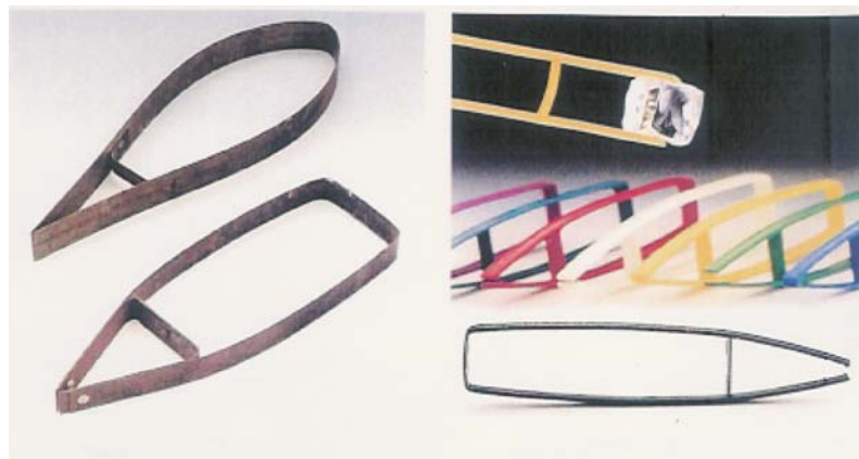
IMATGE A. Pinces de gel, 1964.

Analitzeu aquest objecte i destaqueu la variació singular que el diferencia de les pinces tradicionals pel que fa a l'ús. Per fer-ho, podeu dibuixar esquemes explicatius del funcionament i de l'adaptació ergonòmica de la peça, que podeu acompanyar d'una breu explicació.