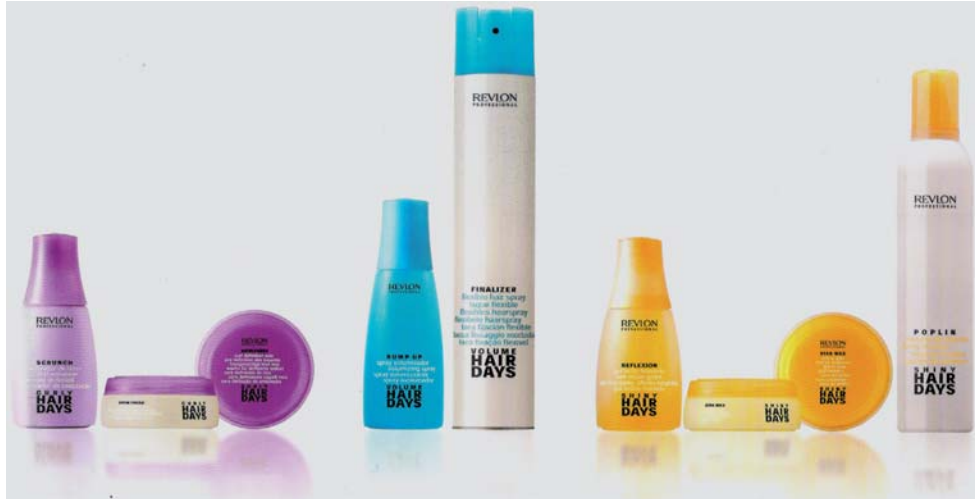
IMATGE H. Imatge gràfica de la línia de productes Hair Days, de Vicenç Marco i Associats.