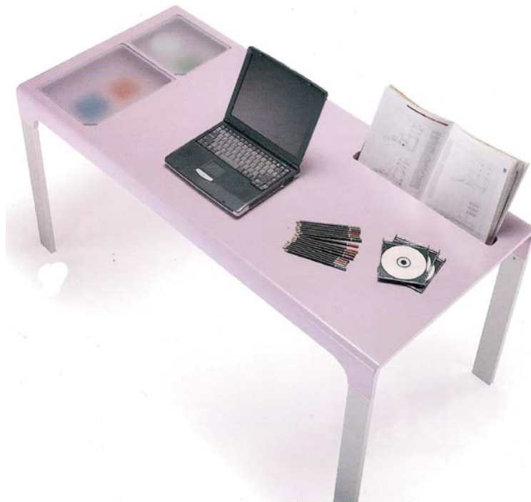
IMATGE D. Taula Work in Progress. Odosdesign, 2003.