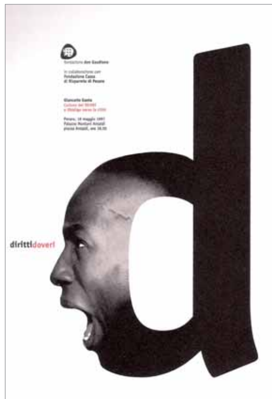
IMATGE D. Cartell de Leonardo Sonnoli per a un congrés sobre drets i deures dels ciutadans a les àrees metropolitanès (1997).