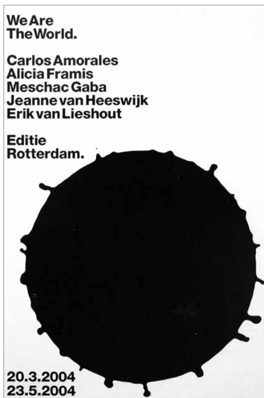
IMATGE C. Cartell d'Experimental Jetset per a una exposició a la Biennial de Venècia (2004).

2.1. Els cartells que es mostren en les imatges C i D presenten algunes semblances i algunes diferències. Exposeu-les de manera ordenada.