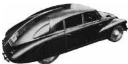
IMATGE A. Tatra V8. F. Porsche, 1938.