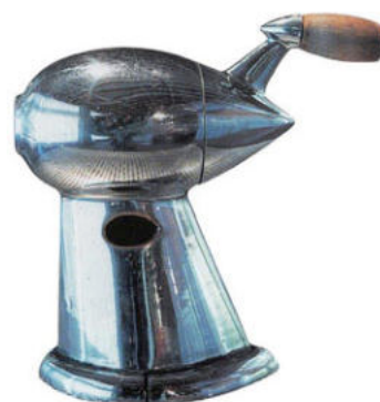
IMATGE B. Afilallapis. R. Loewy, 1934.