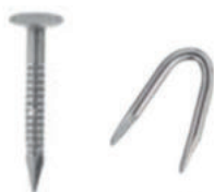
IMATGE F. Clau per a l'estructura de fusta (esquerra) i grampilló per a subjectar la malla als llistons de fusta (dreta).

Utilitzeu el quadern de respostes obert per a aconseguir el format DIN A3 de la doble plana, de manera que entregueu: