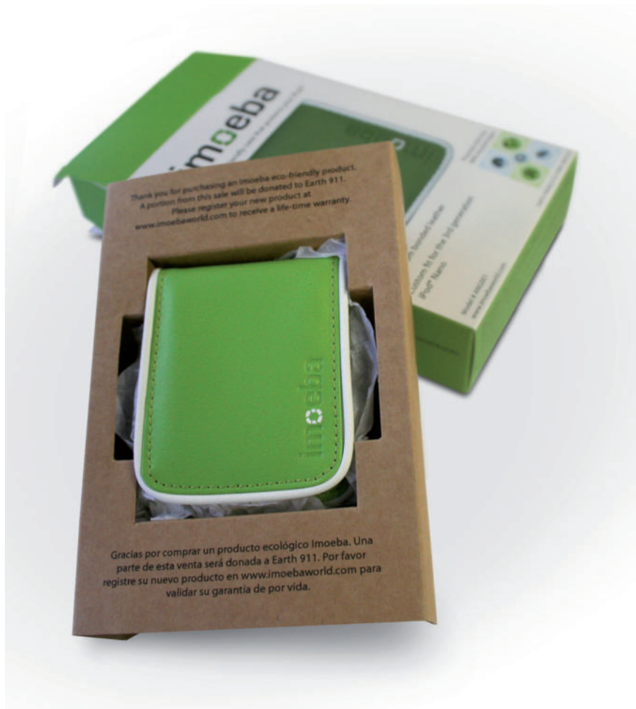
IMATGE D. Ecopack per a la funda d'un iPod.

En la imatge D es mostra un embalatge d'un producte ecològic. Comenteu-ne els atributs gràfics i sígnics que operen en consonància amb la consciència ambiental.