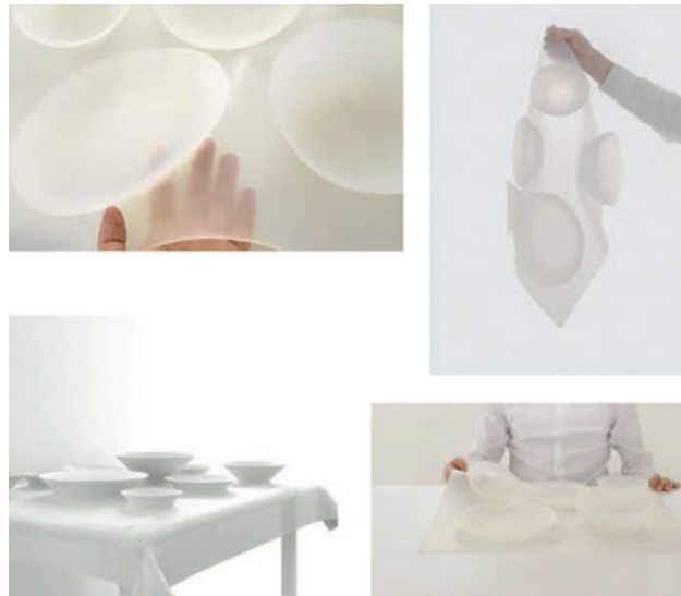
IMATGE B. Meal Tray ('Safata per a Menjar'), feta de silicona i apta per a menjar-hi. MAEZM, Corea, 2008.

Observeu aquest objecte (imatge B) i comenteu-ne els avantatges i els inconvenients. Proposeu alguna millora que en faciliti l'ús quotidià.