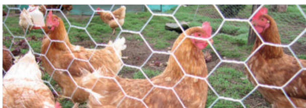
IMATGE E. Model de malla hexagonal.