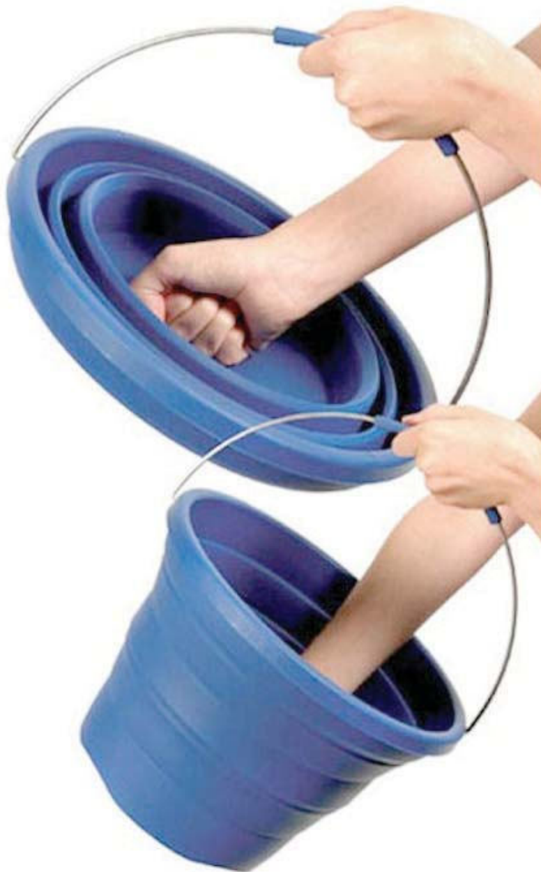
IMATGE B. Pack-Away Bucket

En la imatge B es pot observar un cubell plegable. Expliqueu els avantatges i els inconvenients del cubell plegable respecte als cubells convencionals.