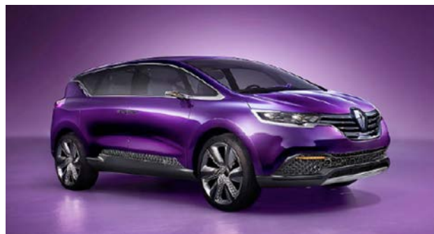
IMATGE B. Prototip del Renault Initiale presentat a la Fira de l'Automòbil de Frankfurt, 2013