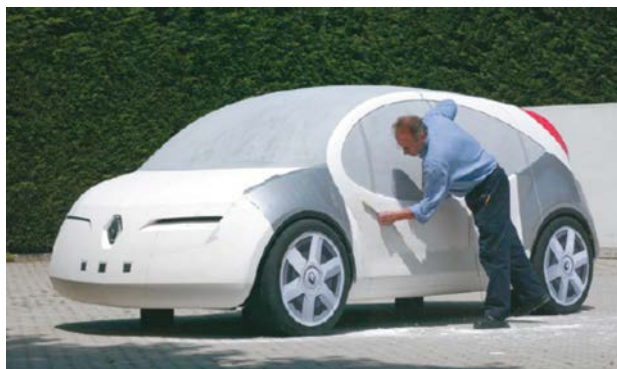
IMATGE A. Maqueta d'un automòbil Renault

La imatge A mostra un operari treballant en l'elaboració de la maqueta d'un automòbil i la imatge B, el prototip d'un automòbil presentat a la Fira de l'Automòbil de Frankfurt del 2013. Les dues representacions de vehicles corresponen a objectes tridimensionals, però hi ha algunes diferències entre l'una i l'altra.