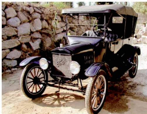
IMATGE A. Ford T. Model fabricat del 1908 al 1927

Henry Ford va aplicar el sistema de producció massiva a la fabricació d'automòbils i va produir el Ford T (imatge A). Aquest era l'únic vehicle que sortia de la seva cadena de muntatge. La reducció radical del nombre de models va comportar la simplificació del procés productiu i, per tant, l'increment d'unitats fabricades. Els operaris es dedicaven a tasques força simples i repetitives, de manera que es guanyava temps en la fabricació global dels vehicles i s'evitaven errors de muntatge.