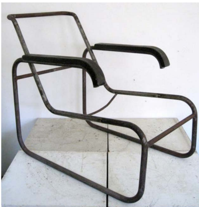
IMATGE H. B 35. Marcel Breuer, 1929

L'acer inoxidable té molt bona estabilitat i resistència, una lleugera flexibilitat i moltes possibilitats de corbar-se en totes les direccions. Per això, amb poques peces i juntes d'unió s'aconsegueixen formes i estructures simples.