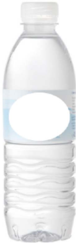
IMATGE D. Ampolla d'aigua de 50 cl que ha de dur l'etiqueta commemorativa de les 24 h de Motociclisme

Els organitzadors de les 24 h de Motociclisme del circuit de Montmeló han decidit etiquetar les ampolles d'aigua que es comercialitzaran a la cursa. Proposen que l'etiqueta sigui atractiva i identificativa de la cursa perquè les persones es vulguin emportar l'ampolla de record i així disminueixi la quantitat d'ampolles que s'hauran de recollir després de la cursa. També proposen que els colors emprats en l'etiqueta siguin més cridaners que els de les etiquetes tradicionals per a facilitar la recollida de les ampolles que hagin quedat al circuit. A més, l'etiqueta ha d'incloure la capacitat de l'ampolla, un espai per a descriure la composició del producte i el codi de barres.