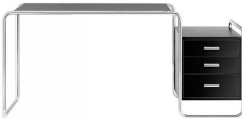
IMATGE G. B 65. Marcel Breuer, 1929

Les imatges G i H mostren dos exemples de mobiliari elaborat amb tub d'acer inoxidable corbat. Tant la taula de treball com la cadira estan fetes amb un sol tub que descriu les corbes necessàries per a aconseguir una estructura prou estable.