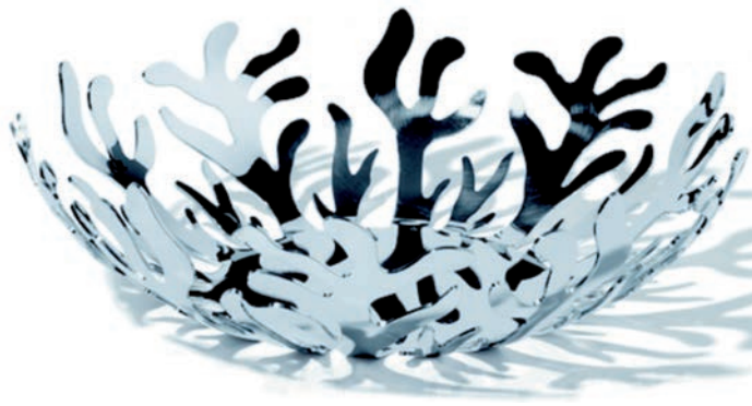
IMATGE A. Fruitera Mediterraneo . Emma Silvestris. Alessi. 29 cm