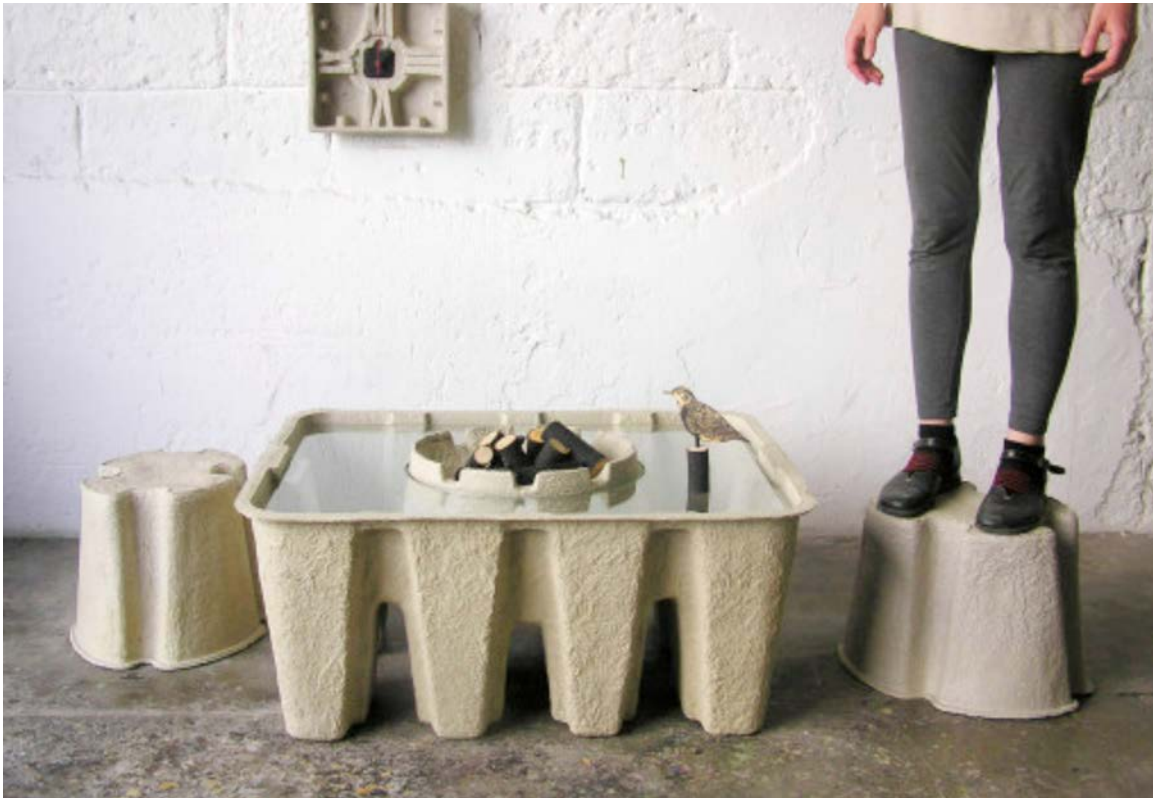
IMATGE A. Pulp Furniture . Dan Hochberg i Odelia Lavie, 2008

Comenteu els avantatges i els inconvenients que presenta aquest tipus de mobiliari tant per al medi ambient com per als usuaris.