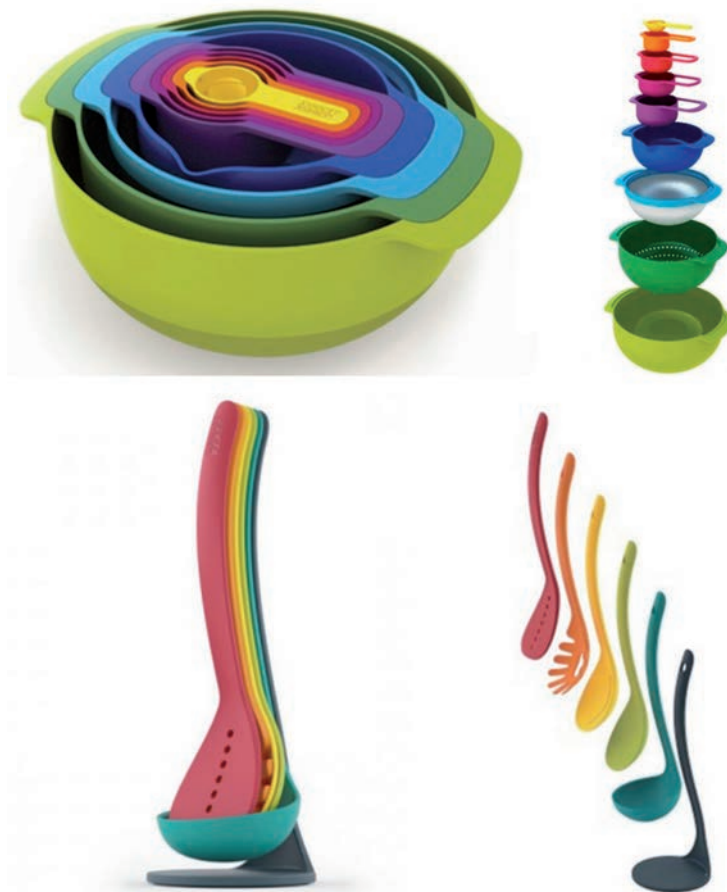
IMATGE B. Estris de cuina de la firma Joseph Joseph