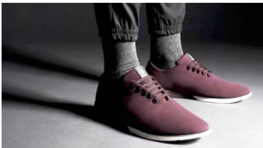
IMATGE A. Sabatilles Atom

Traducció feta a partir del text «Los zapatos españoles que se buscan en todo el mundo». El País . ICON (6 novembre 2014)