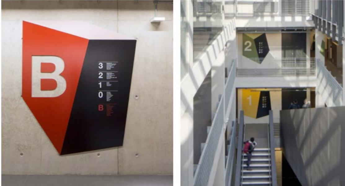
IMATGE B. Senyalització per a l'edifici de la biblioteca de la Universitat de Greenwich. Holmes Wood

En la imatge B podem observar diversos detalls de la senyalització elaborada per a una biblioteca universitària, premiada als European Design Awards l'any 2015.