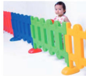
IMATGE G. Tanca separadora de plàstic multicolor

Heu de dissenyar un mòdul vertical de 2 \times 1 m i una porta d' 1 \times 1 m (per a poder accedir a la zona de joc amb un cotxet), que s'han de fabricar amb un material no tòxic, de manera que podeu triar entre fusta o plàstic.