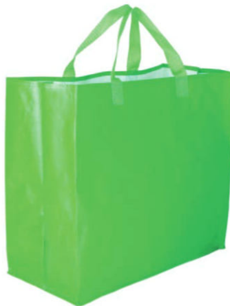
IMATGE C. Bossa de ràfia verda que s'utilitzarà per a promocionar la iniciativa de Retorna

Per a incentivar la implicació dels ciutadans en la iniciativa de Retorna, es vol repartir una bossa de ràfia (imatge C) en comerços i supermercats destinada a transportar els envasos fins al punt de recollida.