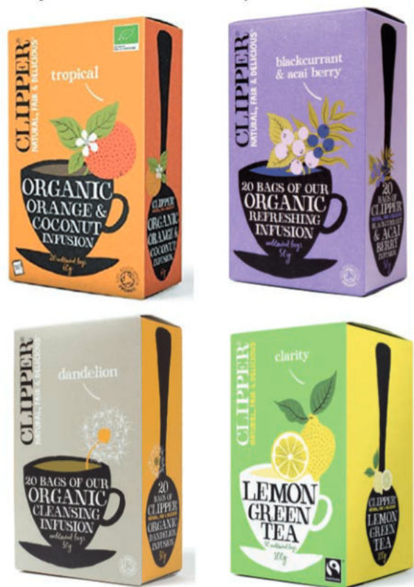
IMATGE E. Mostres d'envasos de tes ecològics de la marca Clipper

Big Fish, una empresa de branding , va redissenyar la imatge de Clipper. Amb el nou disseny es pretenia transmetre un missatge que fes èmfasi en el gust i que posicionés la marca com a «natural, justa i deliciosa».