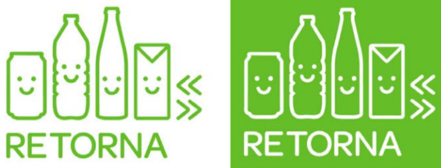
IMATGE D. Imatge gràfica de Retorna en positiu i negatiu

Podeu crear imatges noves o utilitzar la imatge gràfica de Retorna (imatge D) i incloure-hi el lema «Residu zero». Podeu fer el vostre disseny a escala de reducció (1:2) per a ajustar-vos a l'espai de resposta de què disposeu.