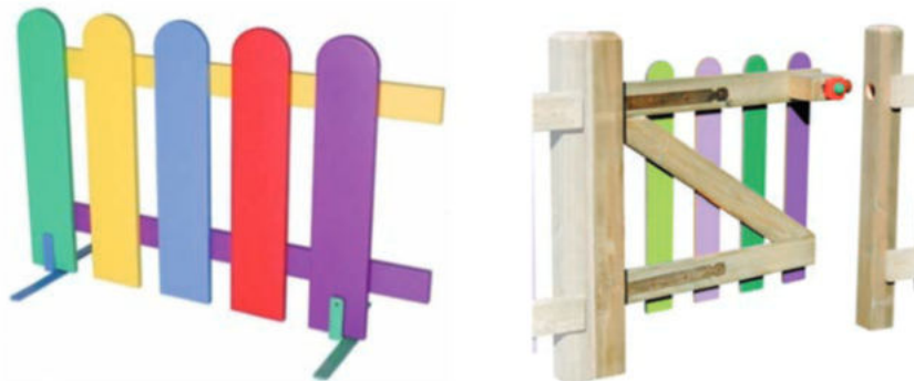
IMATGE H. Exemples de detalls constructius

En el vostre disseny, assenyaieu els detalls constructius, com els encaixos entre els mòduls, el tancament senzill de la porta o els elements que sostenen la tanca. Observeu alguns exemples de detalls d'aquest tipus en la imatge H, per si us poden ajudar.