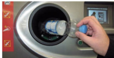
IMATGE B. Detall d'un punt de recollida d'envasos de Retorna

Per tal d'assolir el seu objectiu de «Residu zero» i com a primera etapa d'aquest procés, Retorna proposa la implantació de l'anomenat sistema de dipòsit, devolució i retorn (SDDR) (imatge B), que és un sistema de retorn d'envasos semblant al que es feia servir quan es retornava l'envàs a la botiga. Aquesta pràctica va funcionar a Catalunya fins als anys vuitanta i actualment s'aplica amb èxit en més de quaranta regions del món, com Austràlia, Alemanya, els països nòrdics, Califòrnia o Nova York.