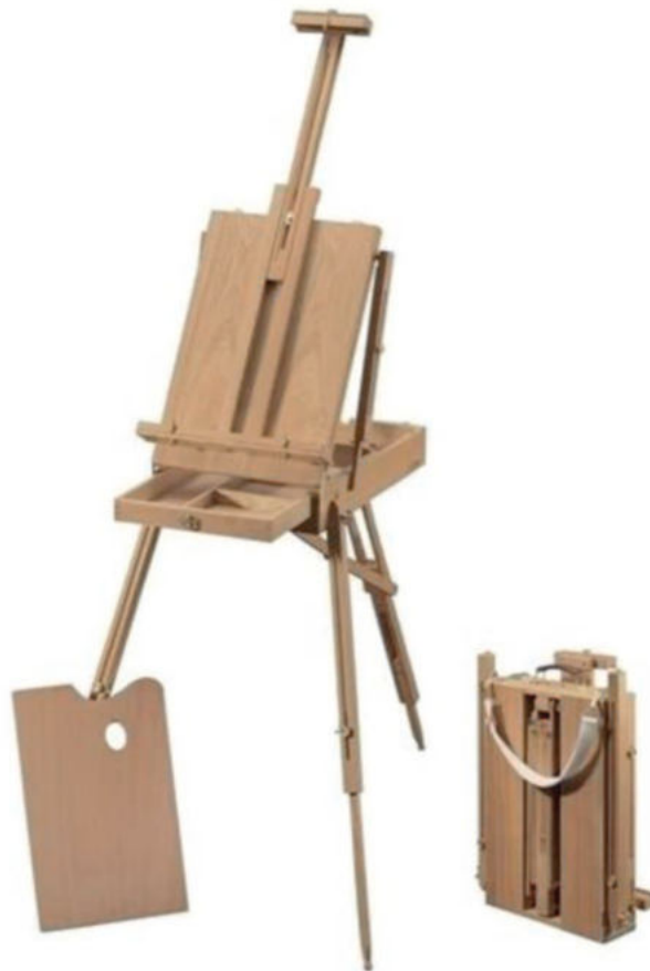
IMATGE A. Cavallet professional francès plegable, de tipus sketch box , fabricat amb fusta

Observeu la imatge A i imagineu que, com aquells pintors impressionistes, voleu sortir al camp a pintar paisatges.