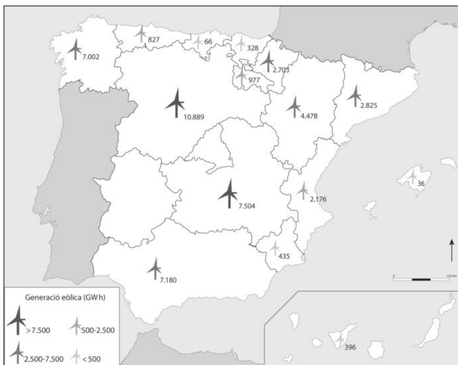
L'energia eòlica a Espanya

FONT: Adaptació d'un mapa publicat a RED ELÉCTRICA DE ESPAÑA. Las energías renovables en el sistema eléctrico español [en línia], 2017.