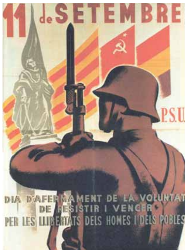
FONT: Partit Socialista Unificat de Catalunya, 1938.