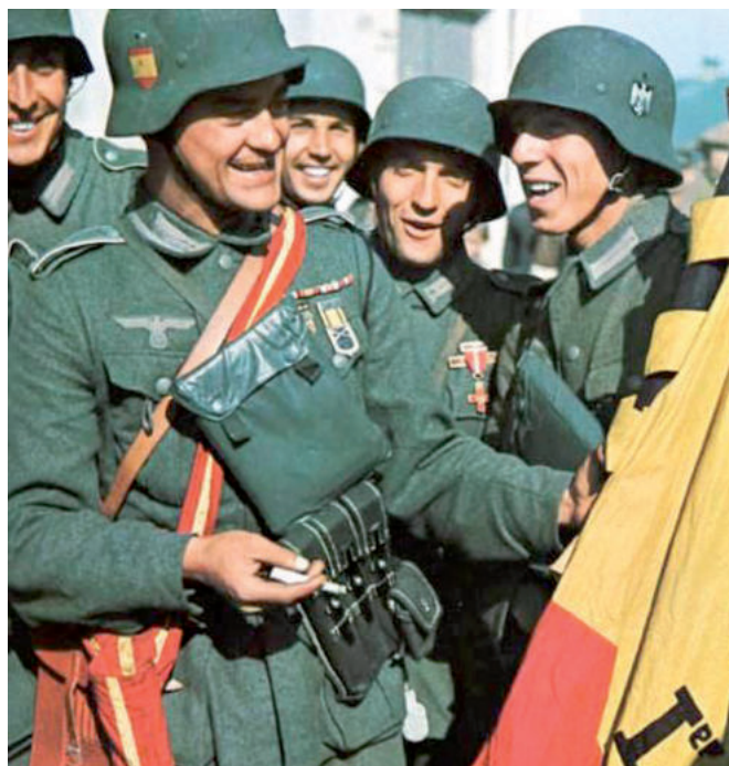
FONT: División Azul , 1941.