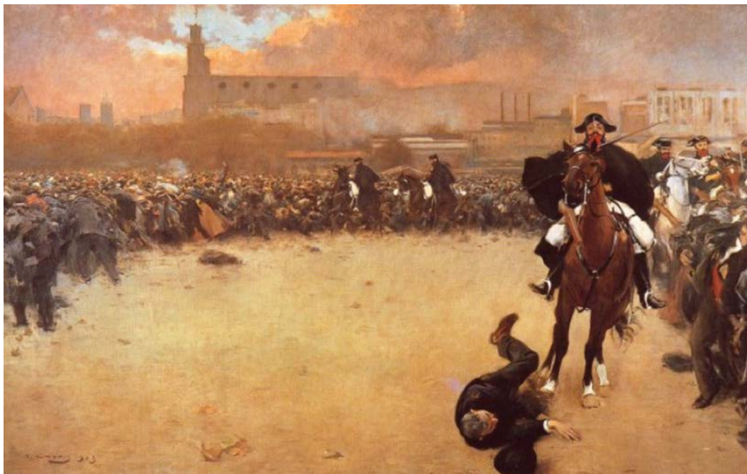
La càrrega o Barcelona 1902

FONT: Ramon Casas, 1899 (Museu de la Garrotxa, Olot).