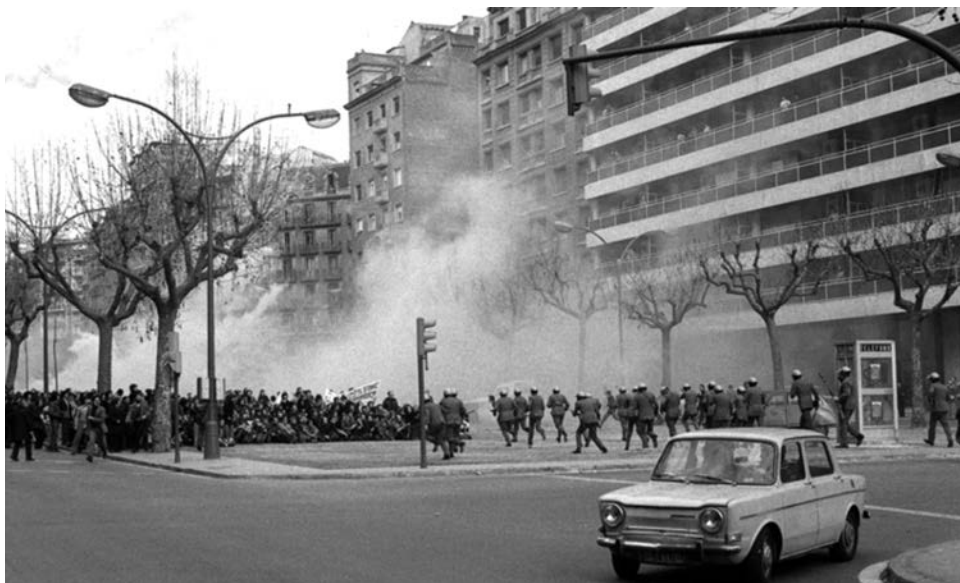
Manifestació proamnistia a Barcelona.