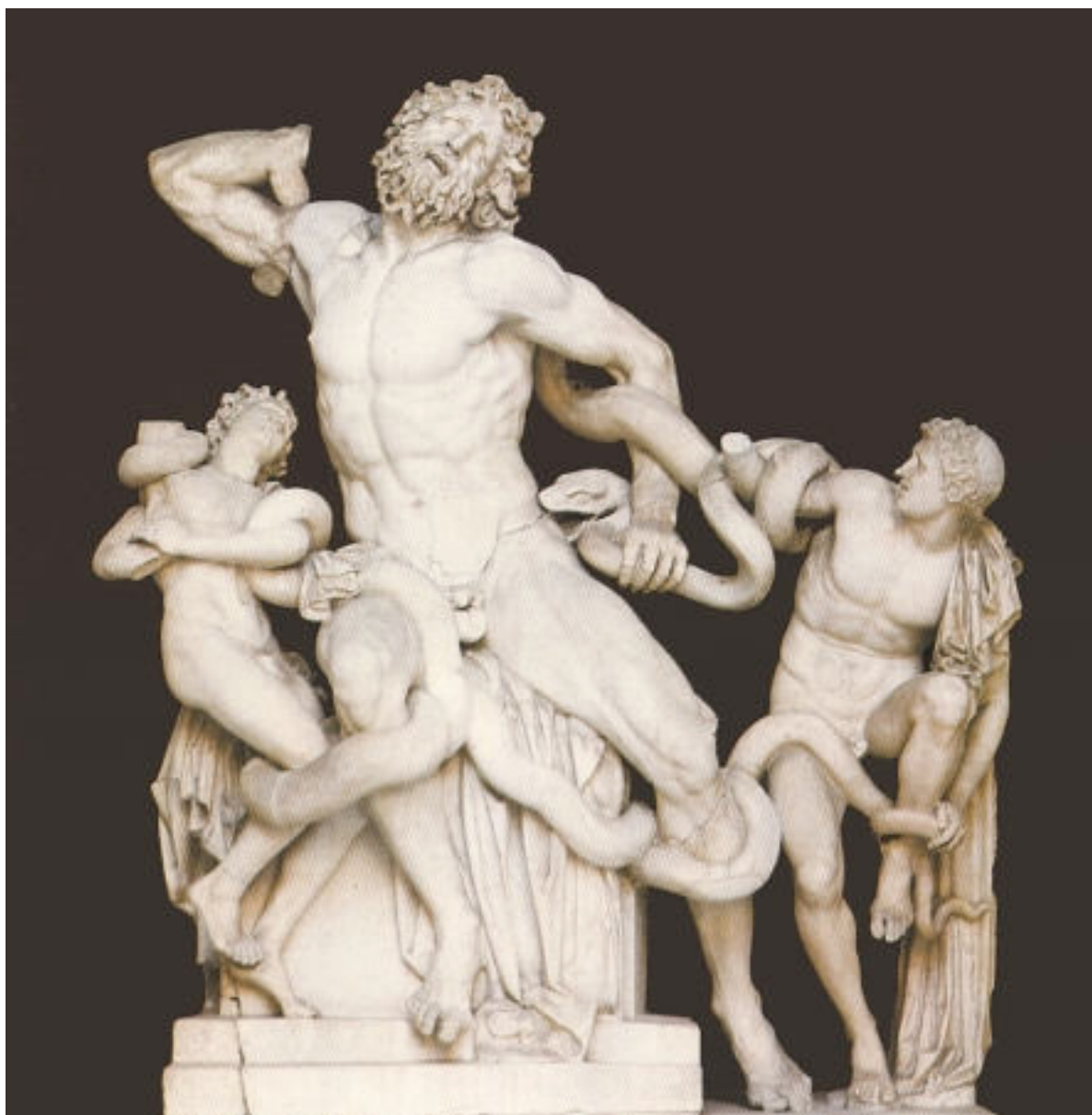
Obra 2: Laocoont i els seus fills.