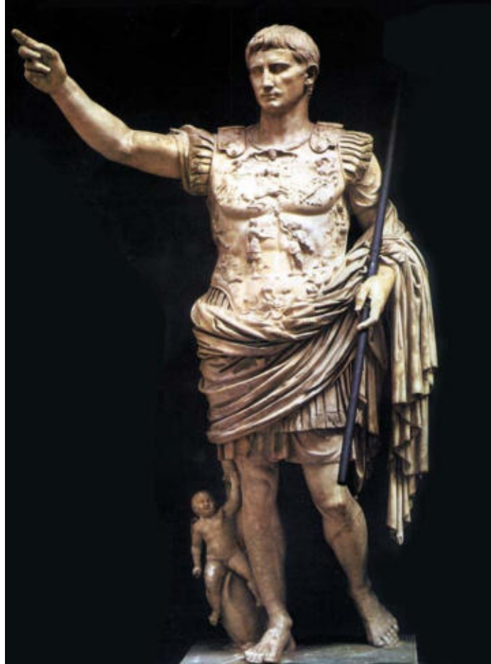
OBRA 2. August de Prima Porta.