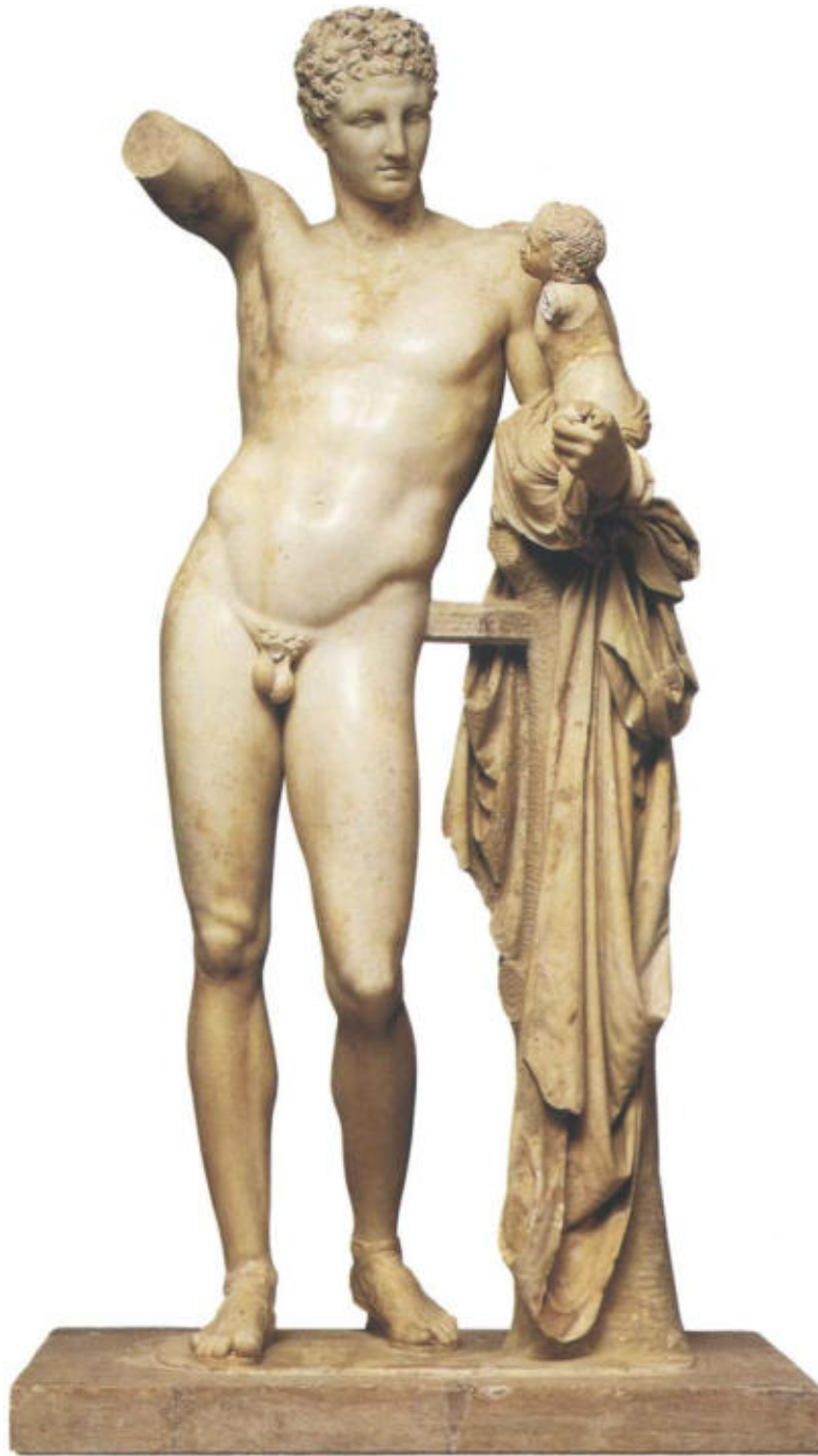
OBRA 2. Hermes amb el nen Dionís , de Praxíteles.