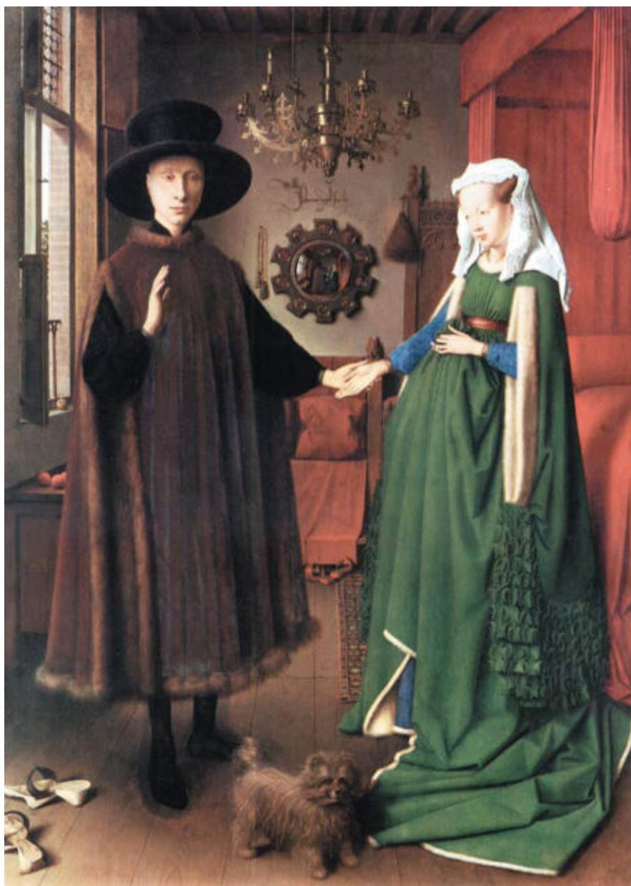
OBRA 3. El matrimoni Arnolfini , de Jan van Eyck.