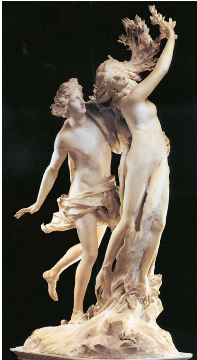
Apol·lo i Dafne , de Gian Lorenzo Bernini.