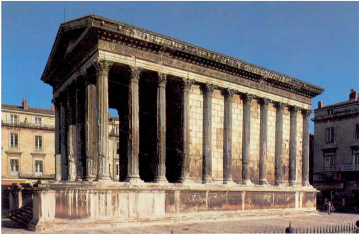
Maison Carrée (Nîmes, França).