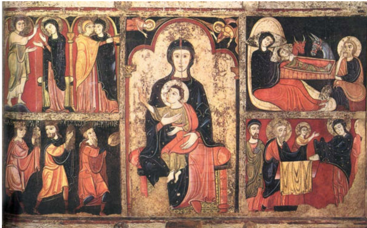
OBRA 3. Frontal de l'altar d'Avià (Berguedà).