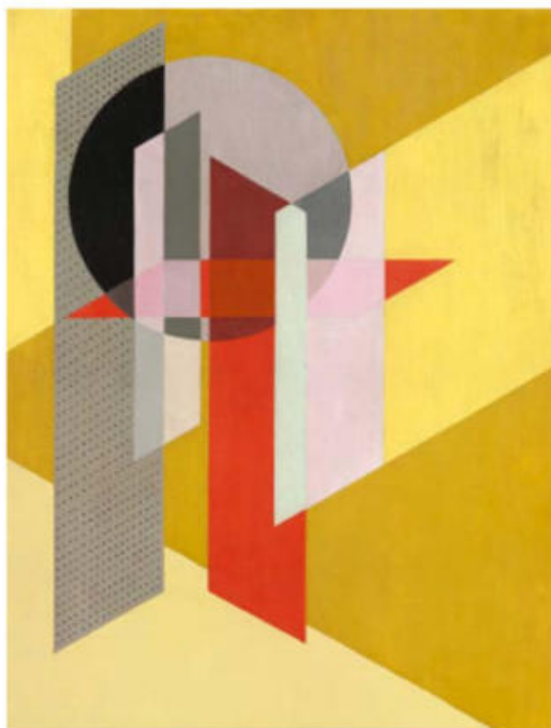
László Moholy-Nagy. Z VII (1926). Pintura a l'oli de la sèrie «Z».