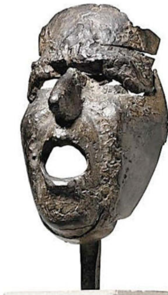
Juli González. Màscara de Montserrat cridant (1939). Bronze fos, 32,8 × 14,9 × 12 cm.

Observeu la imatge següent. Fixeu-vos també en l'any i el títol.