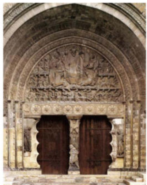
Portalada de Sant Pere de Moissac