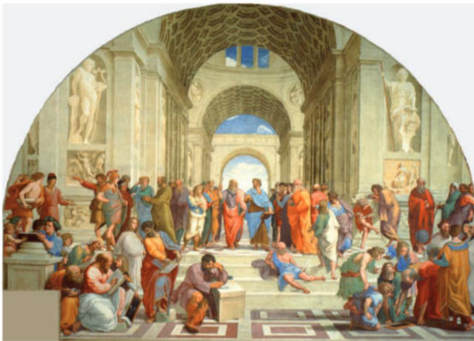
L'escola d'Atenes, de Rafael