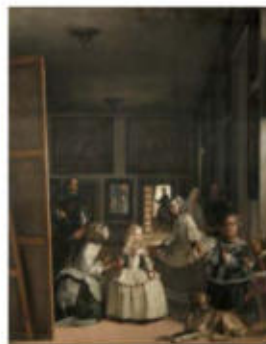
Las Meninas, de Velázquez