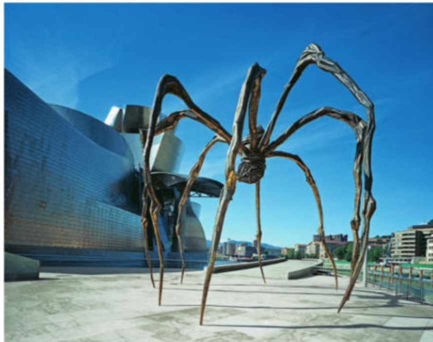
Maman , de Louise Bourgeois