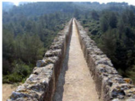
Aqüeducte de les Ferreres o Pont del Diable

a) Dateu l'obra i situeu-la en el context històric i cultural corresponent.