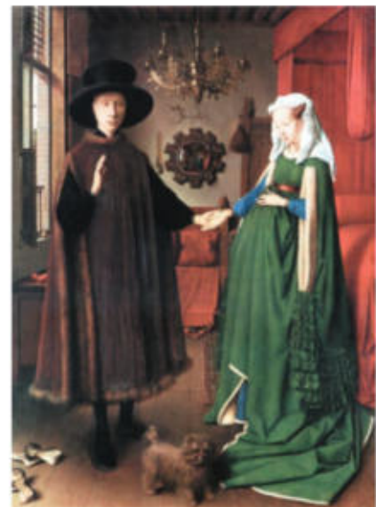
El matrimoni Arnolfini, de Jan van Eyck