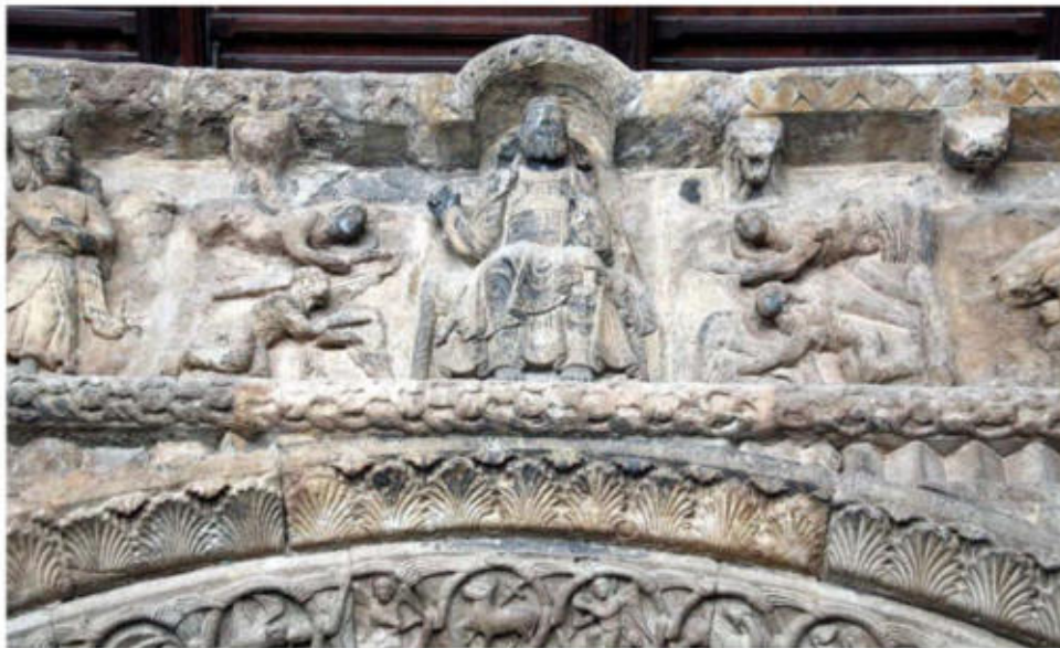
Portalada del monestir de Santa Maria de Ripoll

a) Dateu l'obra i situeu-la en el context històric i cultural corresponent.