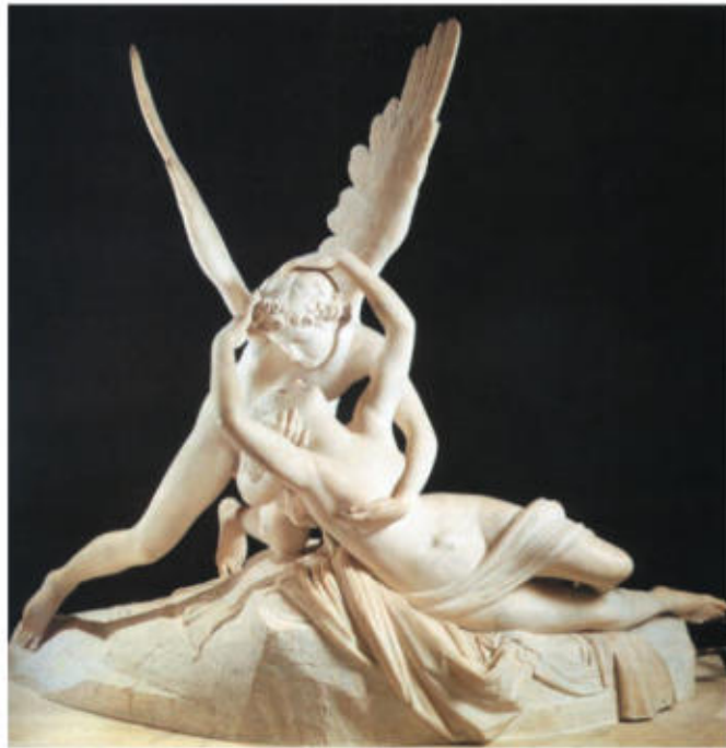
Eros i Psique , d'Antonio Canova