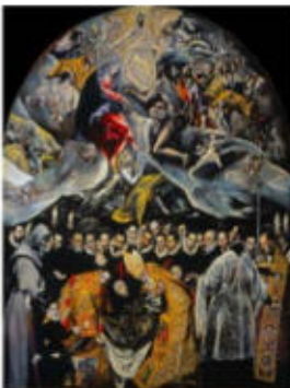
L'enterrament del senyor d'Orgaz, d'El Greco

e) Situeu en l'eix cronològic, mitjançant fletxes, les obres que es reproduïxen a continuació.