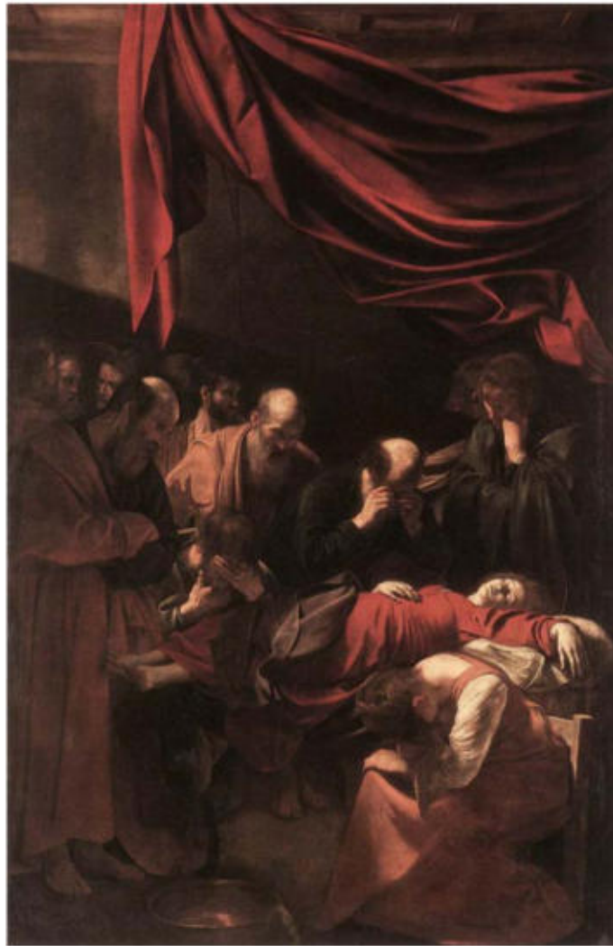
La mort de la Mare de Déu, de Caravaggio

a) Dateu l'obra i situeu-la en el context històric i cultural corresponent.