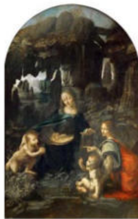
Mare de Déu de les Roques, de Leonardo da Vinci