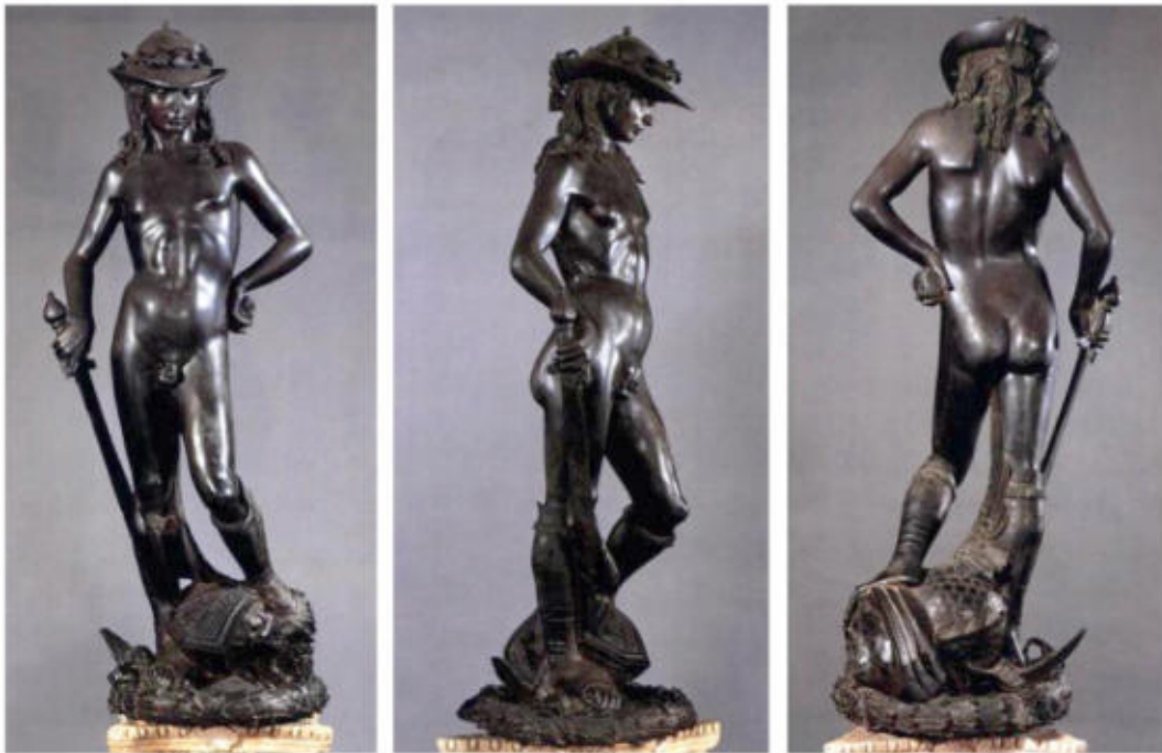
David , de Donatello

a) Dateu l'obra i situeu-la en el context històric i cultural corresponent.