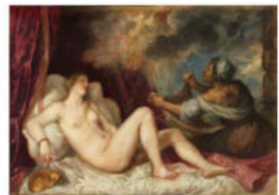
Danae rebent la pluja d'or, de Ticià