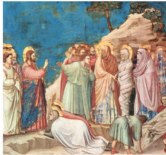
Capella dels Scrovegni o de l'Arena, de Giotto

a) Dateu l'obra i situeu-la en el context històric i cultural corresponent.