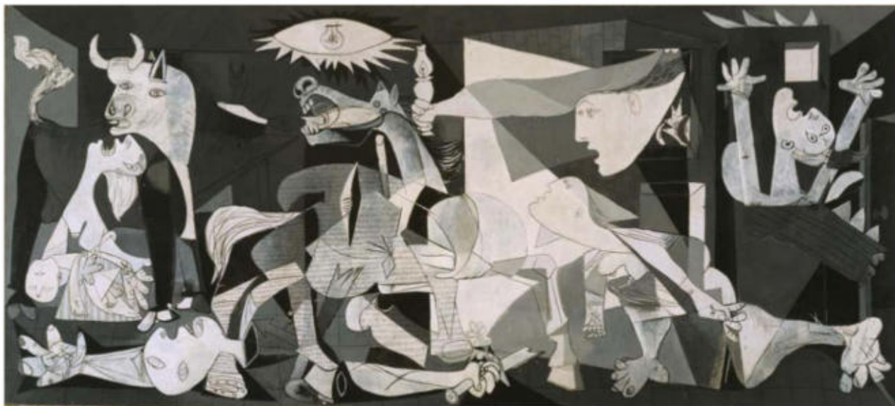
Guernica , de Pablo Ruiz Picasso