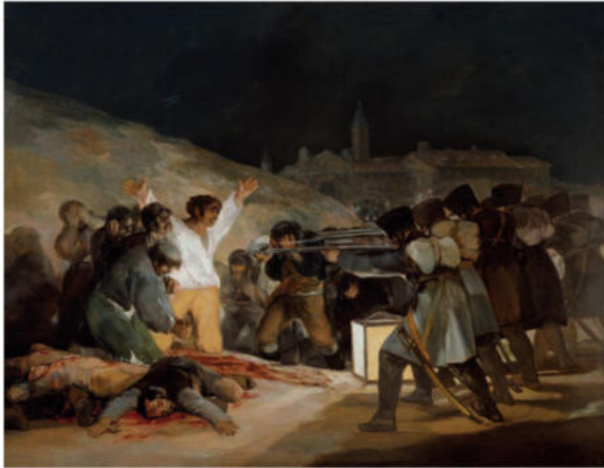
Els afusellaments o El 3 de maig a Madrid, de Francisco de Goya