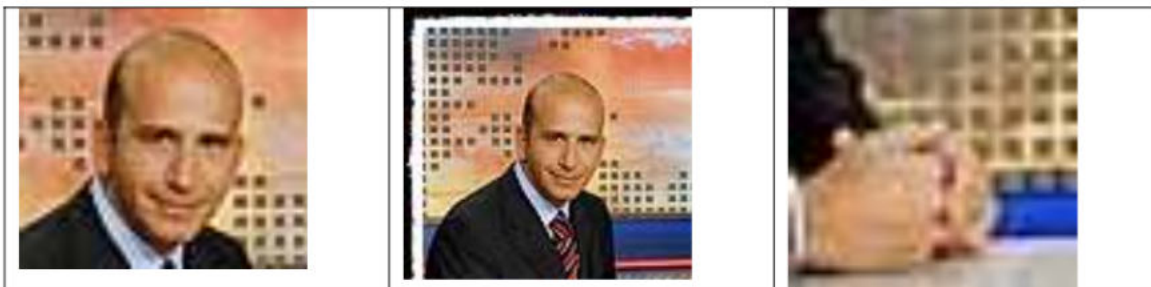
Primerisim primer pla