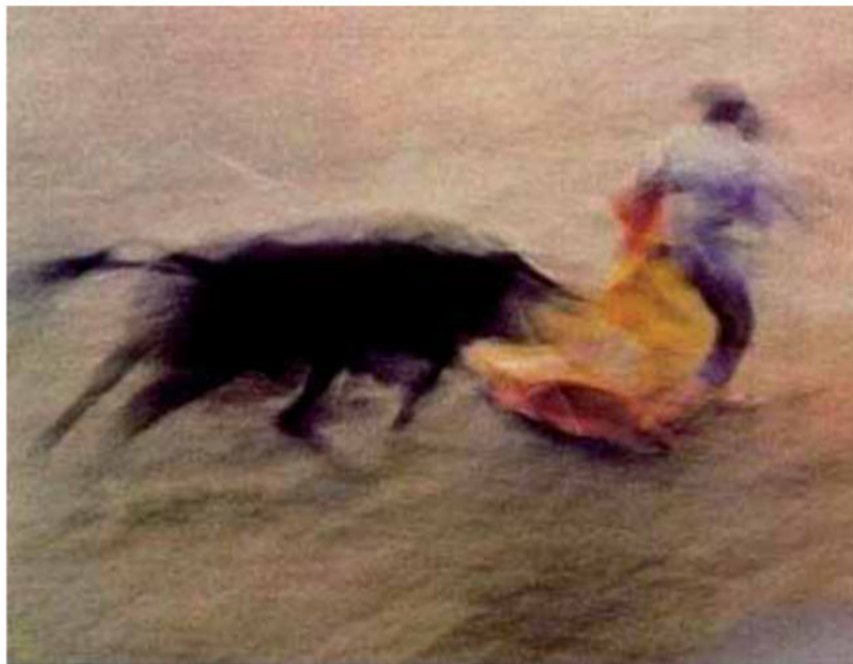
FOTOGRAFIA B. Bullfight , Ernst Haas, 1956.