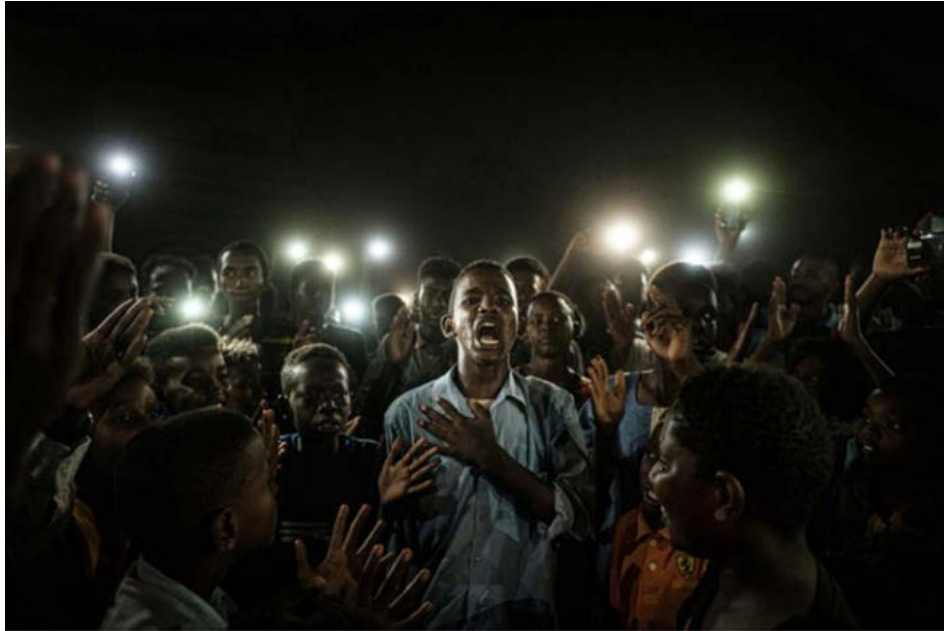
Straight Voice , de Yasuyoshi Chiba (2019). Primer premi del concurs World Press Photo 2020.

Observeu atentament la fotografia següent, obra del fotògraf Yasuyoshi Chiba (2019), i responeu a les qüestions 2.1, 2.2 i 2.3.