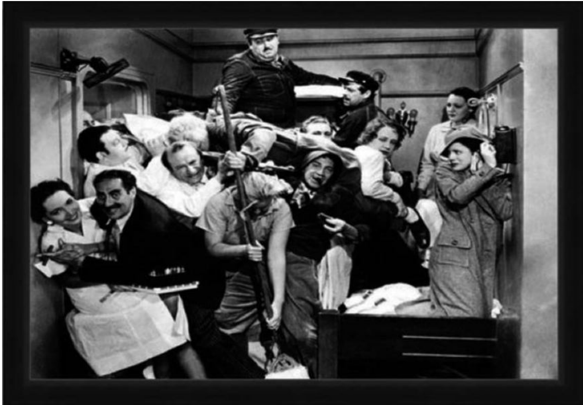
Fotograma d' Una nit a l'òpera (1935), de Sam Wood.

Observeu atentament el fotograma següent de la pel·lícula Una nit a l'òpera (1935), de Sam Wood, i responeu a les qüestions 2.1, 2.2 i 2.3.