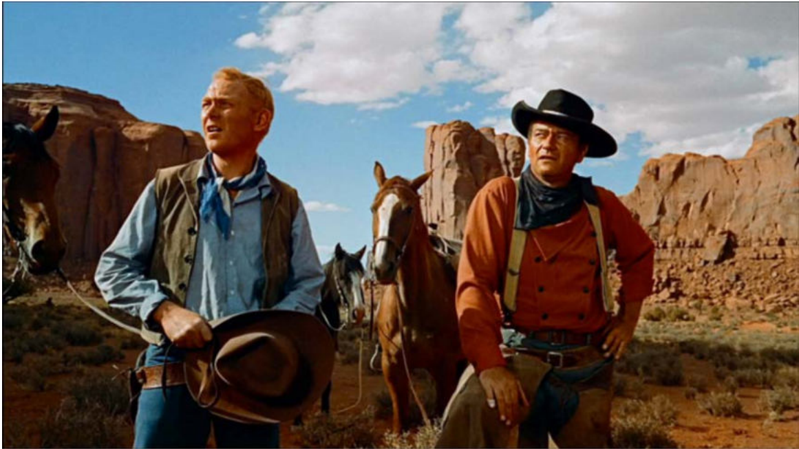
Fotograma de Centaures del desert (1956), de John Ford.

Observeu atentament el fotograma següent de la pel·lícula Centaures del desert (1956), de John Ford, i responeu a les qüestions 2.1, 2.2 i 2.3.