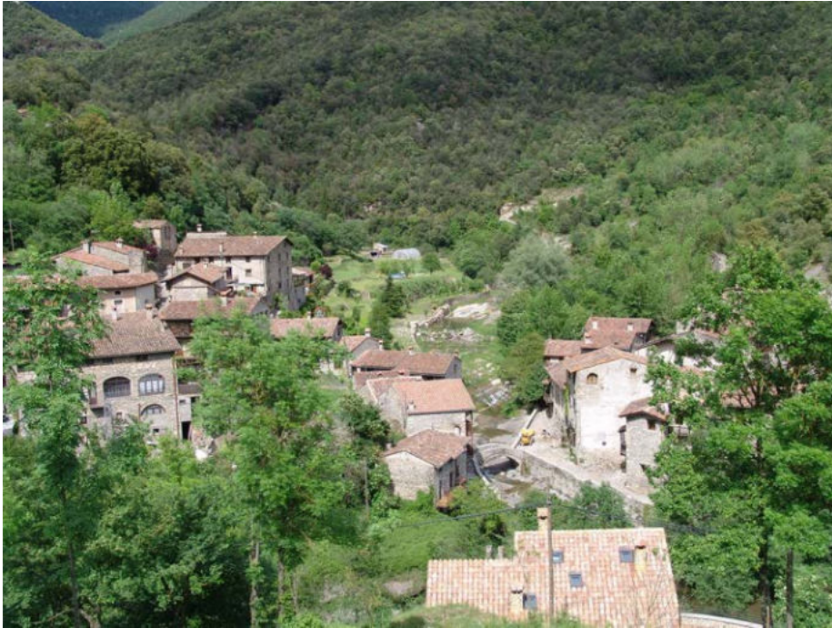
Paisatge de muntanya mitjana