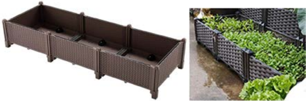
IMATGE F. Jardinerera Cowslip per a terrats, balcons i patis

Observeu la jardinerera de la imatge F, que té autoreg i forats per a facilitar el drenatge de l'aigua. Les dimensions de la jardinerera són: 120 cm d'amplària, 40 cm de fondària i 22 cm d'alçària.