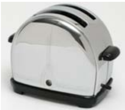
IMATGE A. Model Sunbeam T9 (1935), dissenyat per Raymond Loewy

Observeu les imatges A, B i C, que mostren alguns exemples en els quals es pot identificar un predomini de les funcions pràctica, estètica o simbòlica en el mateix tipus d'artefacte: una torradora de pa.