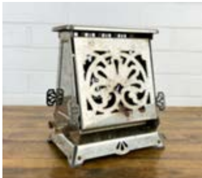
IMATGE B. Model 117T23 (1914), dissenyat per Edison Electric Appliance Company