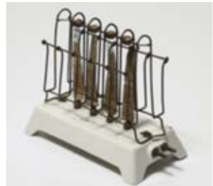
IMATGE C. Model D-2 (1908), dissenyat per General Electric

Responeu UNA de les dues qüestions següents: