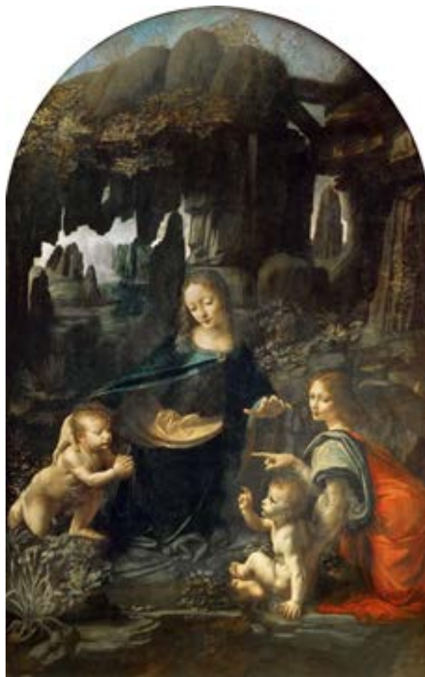
Mare de Déu de les Roques , de Leonardo da Vinci (París, Museu del Louvre)

a) Dateu l'obra i situeu-la en el context històric i cultural corresponent.