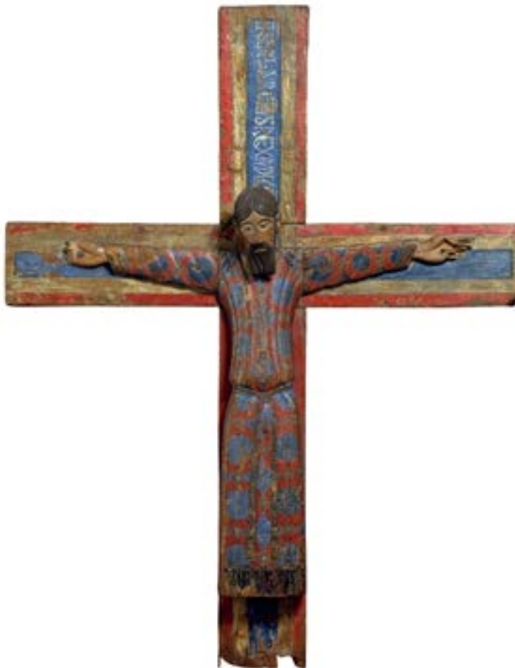
Majestat Batlló (Barcelona, MNAC)

a) Dateu l'obra i situeu-la en el context històric i cultural corresponent.