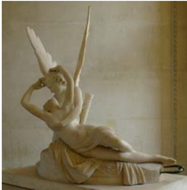
Eros i Psique , d'Antonio Canova (París, Museu del Louvre)