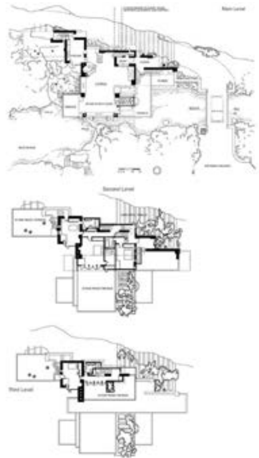
Casa Kaufmann o Casa de la Cascada, de Frank Lloyd Wright (Pensilvània)