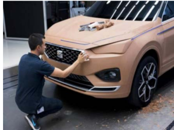
IMATGE B. Modelatge de prototips exteriors a SEAT

Responeu UNA de les dues qüestions següents: