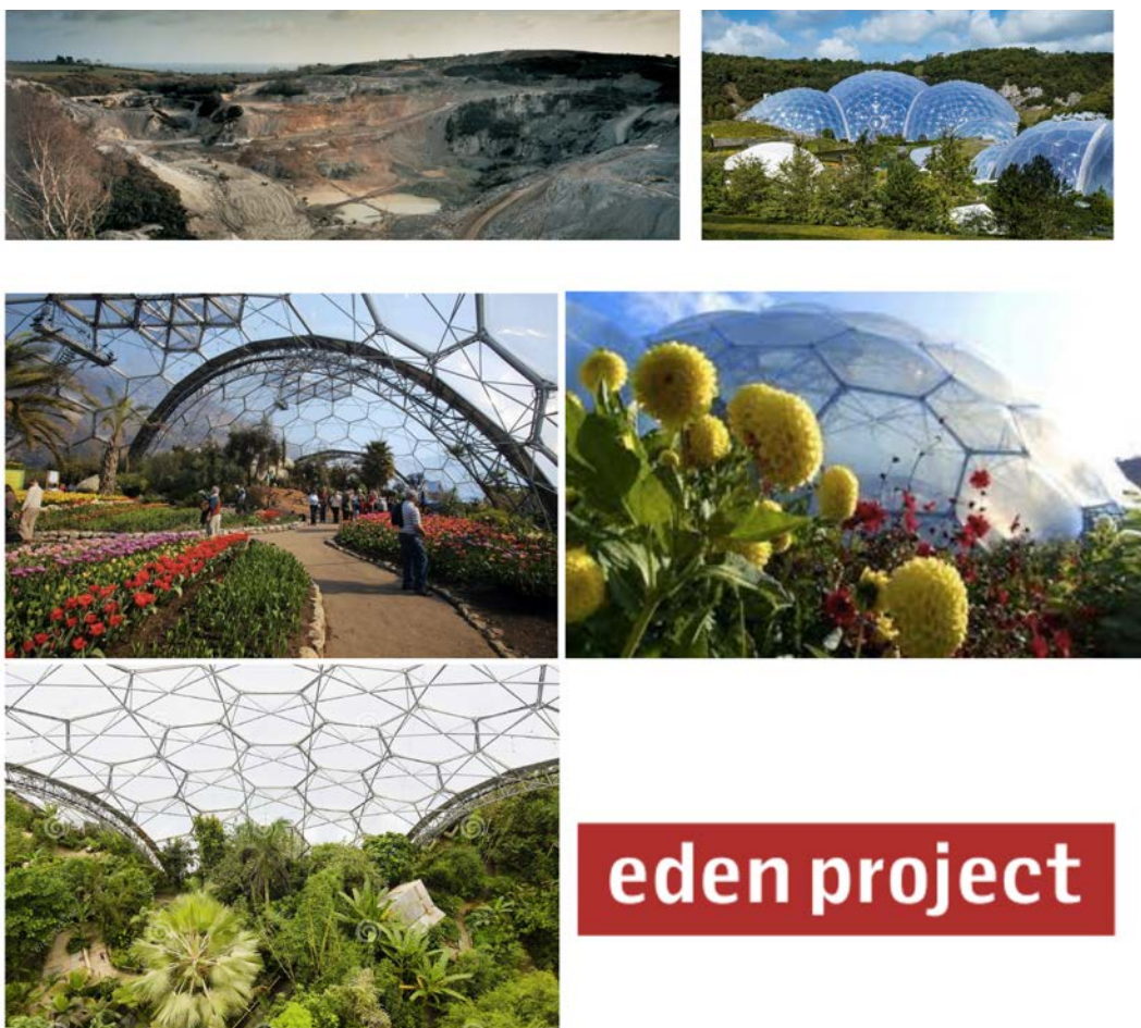
IMATGE H. Fotografies i logotip d'Eden Project, projecte dissenyat per Nicholas Grimshaw. Península de Cornualla, Regne Unit

El repte per a aquest projecte va ser dissenyar els edificis que proporcionessin l'entorn adient per a crear els diferents microclimes. Les cúpules estan construïdes amb una estructura de tubs d'acer galvanitzat que forma una sèrie d'hexàgons, pentàgons i triangles de diferents mides connectats, de manera que es crea una esfera coberta de panells.