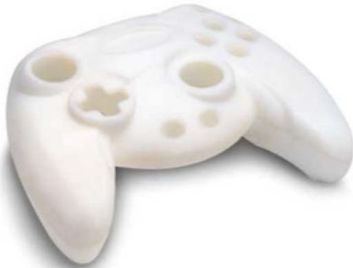
IMATGE A. Prototip ràpid per a disseny industrial. Comandament de plàstic ABS blanc, de 3D New System Construction, SL

Observeu els prototips de les imatges A i B. Els prototips són fonamentals en el procés de disseny i tenen un paper important en l'estudi de la factibilitat d'un producte. Es tracta de versions preliminars que serveixen com a representació o simulació de l'article final. Poden ser una representació del que serà l'objecte resultant a mida real o amb una mida diferent, en format digital o físic, elaborats amb el mateix material o un altre, etc.