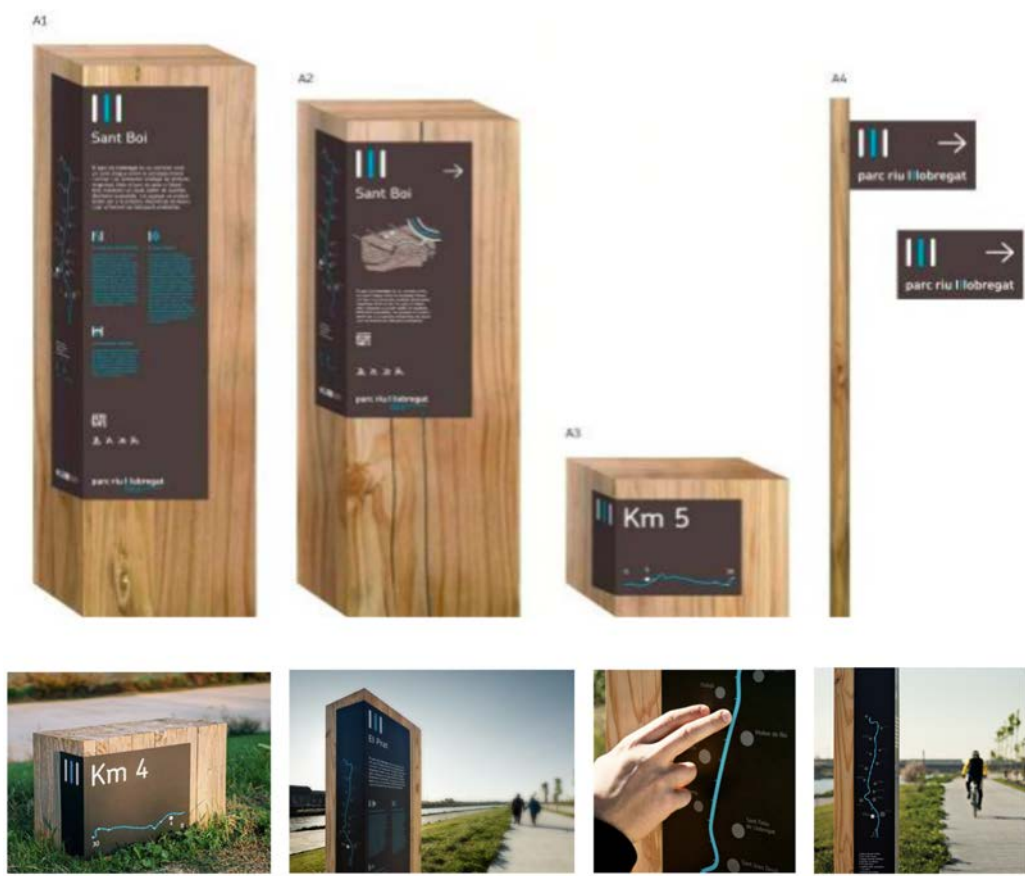
IMATGE C. Fotografies de la senyalització del Parc Riu Llobregat