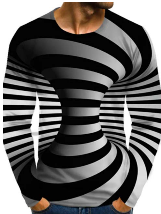
Samarreta de polièster de la botiga en línia de roba i accessoris LightInTheBox (2023).