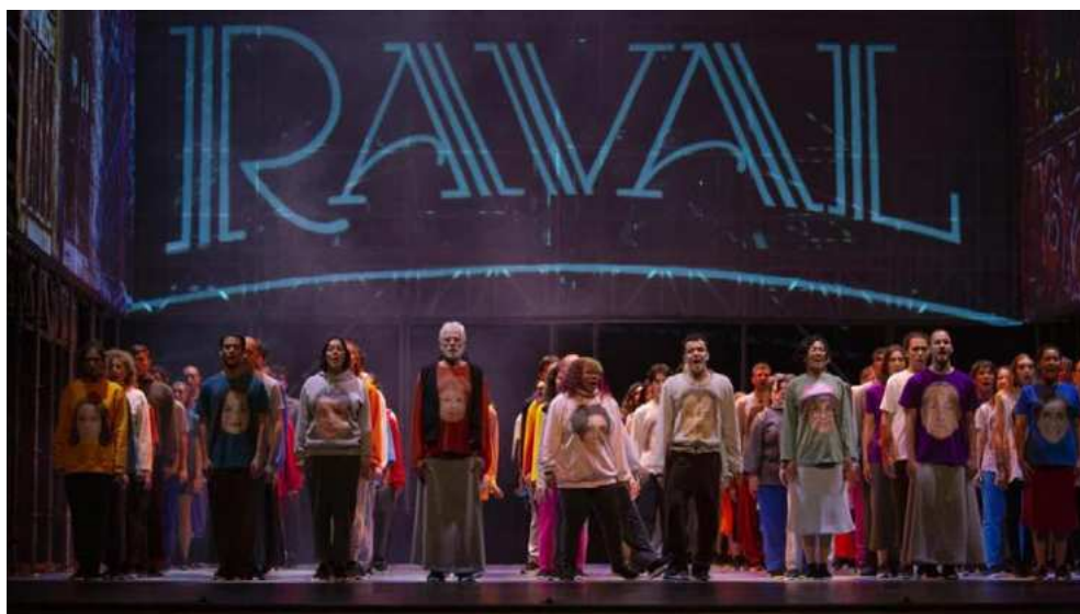
La gata perduda , d'Arnau Tordera i Victoria Szpunberg. Gran Teatre del Liceu, 2022.

El vostre text ha de tenir entre dues-centes i dues-centes cinquanta paraules.