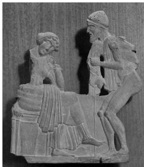
Relleu en terracota datat cap al 450 aC, Museu del Louvre