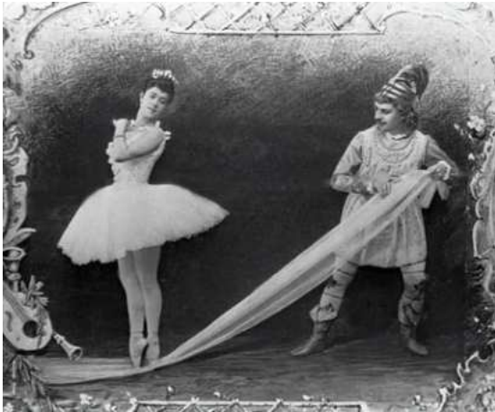
Fotografia. Per darrere hi ha, manuscrit: «Primera representació del ballet El Trencanous »

Entre d'altres objectes, hi trobem els següents: