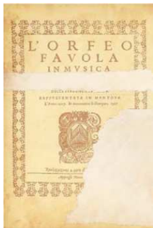
Partitura antiga en què encara es pot llegir: «L'Orfeo. Favola in musica. Rappresentata in Mantova L'Anno 1607»

A l'arxiu d'un teatre d'una ciutat italiana s'han trobat partitures en mal estat i uns objectes antics. L'administració i l'equip gestor del centre estan convençuts que es tracta de material que permetrà programar una òpera, però necessiten l'ajuda d'un expert.