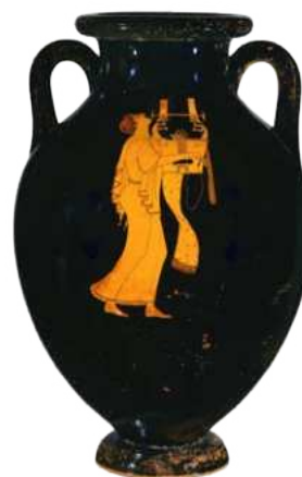
Àmfora de terracota, c. 490 aC (Grècia). Orfeu tocant la lira