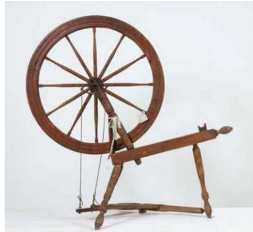
Filosa d'attrezzo per a La Bella Dorment